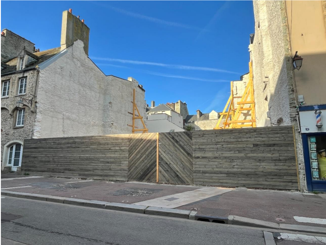
Vue de la palissade implantée Place de la Révolution