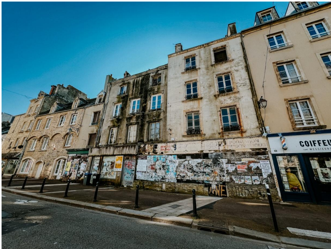
Visuel des bâtiments avant destruction (été 2025)