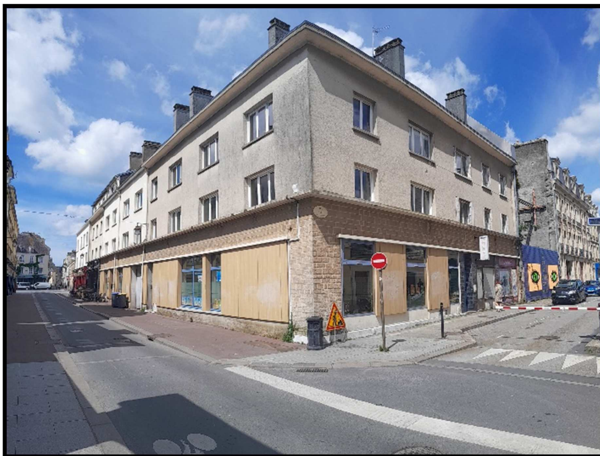
Photo de l'état actuel

Engagement / Citoyenneté / Participation / Expression / Echange / Cohésion / Diversité / Respect / Partage / Projet de Jeunes / Loisirs / Jeunesse