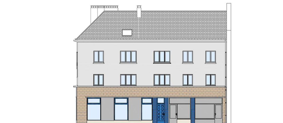
Façade Sud-Est Rue Noël