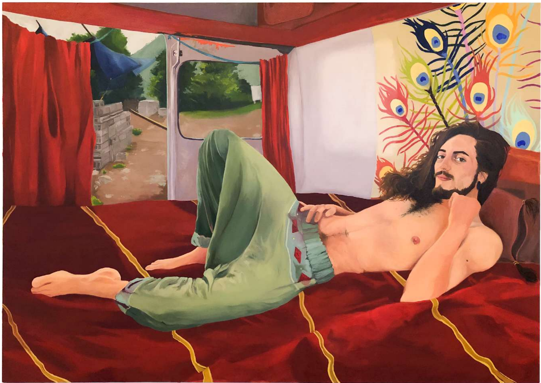
Odalisque , 2022 huile sur toile, 155x110x4cm