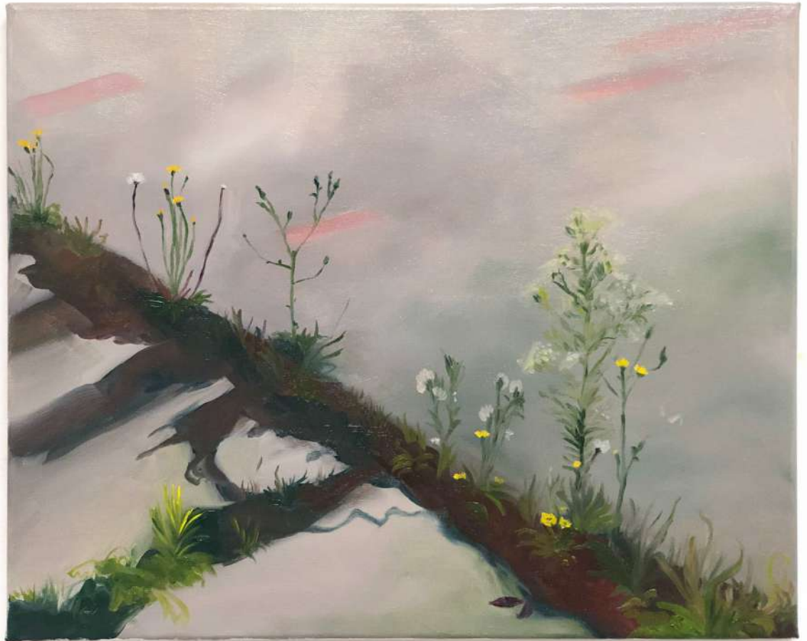
Mauvaise herbe (1) , 2022 huile sur toile, 41x33cm Réalisée au Labo des Arts, Caen