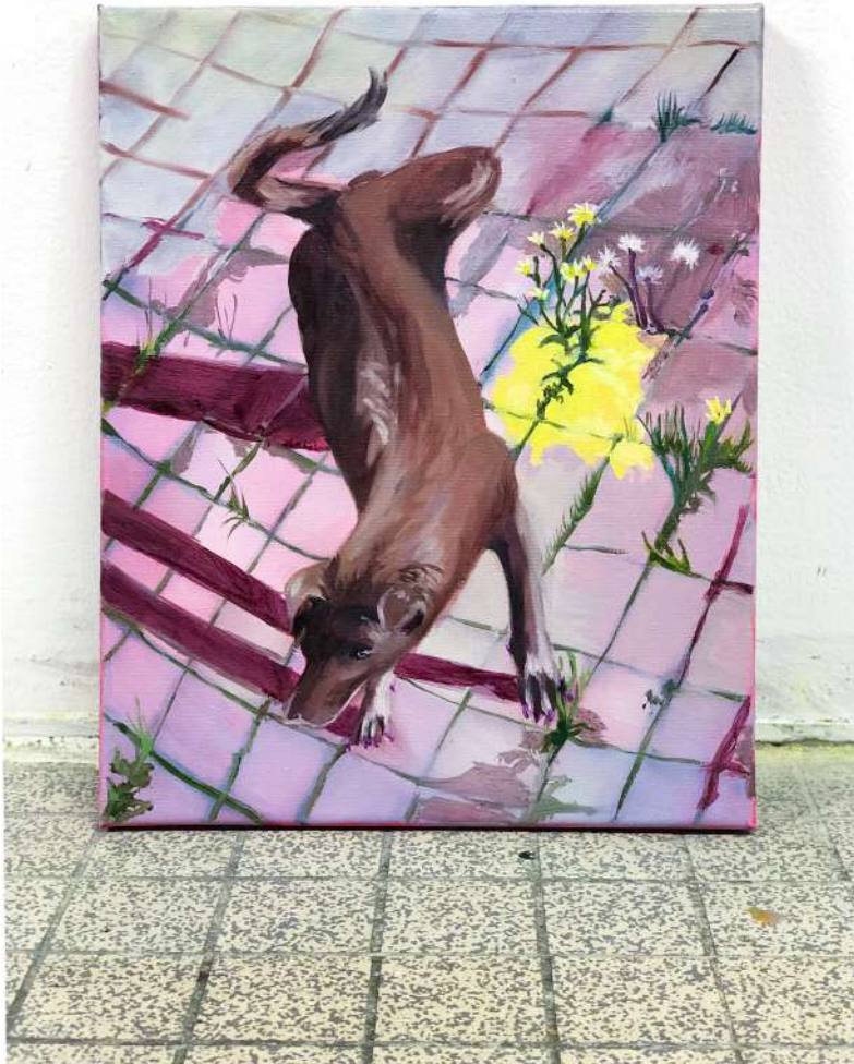
(Sans titre) , 2022 huile sur toile, 30x24cm Réalisée au Labo des Arts, Caen