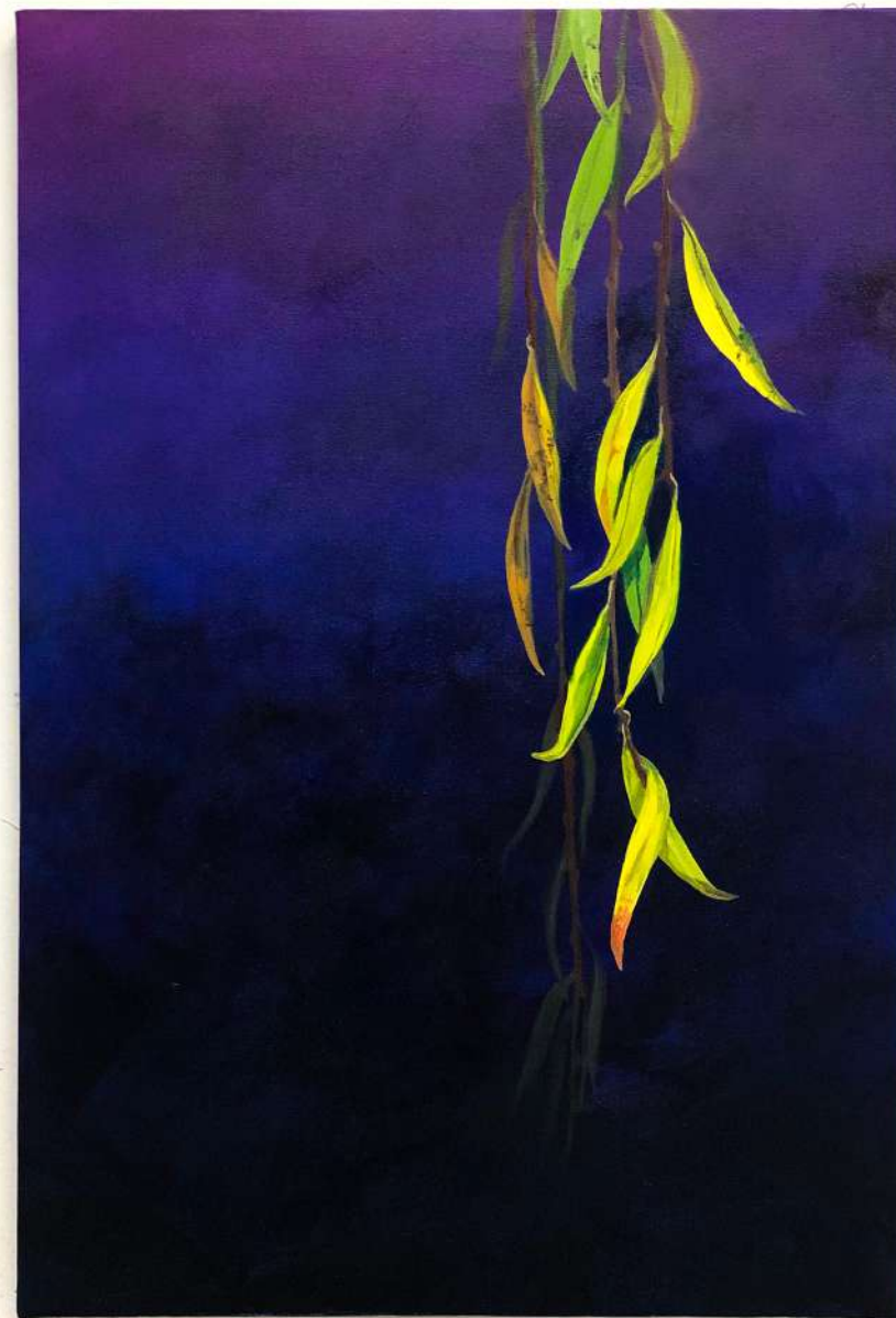
Saule pleureur , 2023 huile sur toile, 53x38cm Réalisée au Labo des Arts, Caen