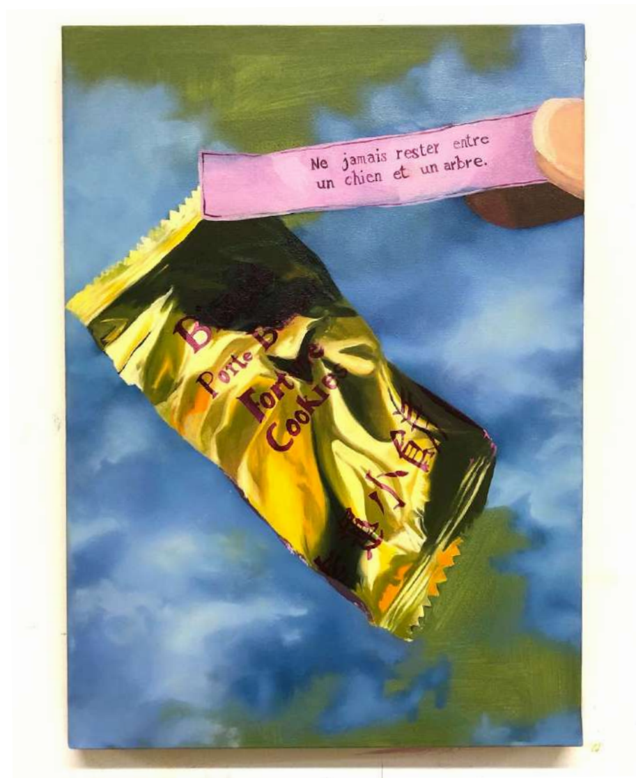
Oracle , 2023 huile sur toile, 46x33cm Réalisée au Labo des Arts, Caen