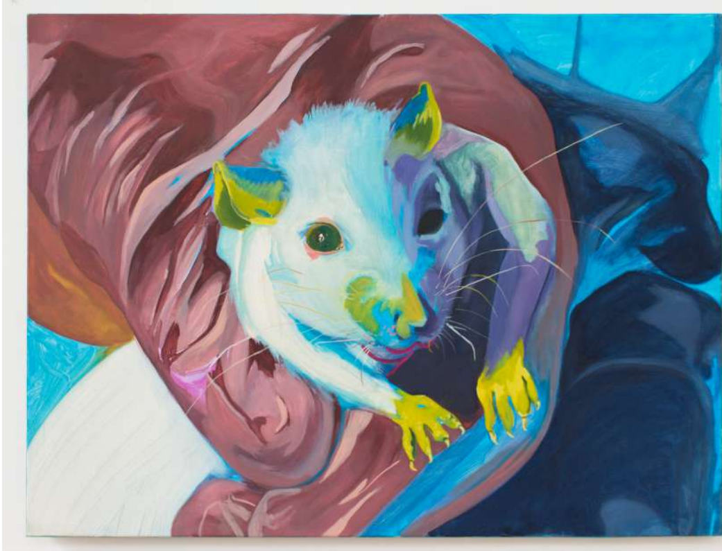
(Em)prise , 2020 huile sur toile, 80x60x3cm

ystériques, les féminazies, les insurgées, celles qui ne lient elles parce qu'il est inscrit dans leur A recettes de livres pitions à tâtons et d'écrire toutes mes sœurs de cœur qui rendent plus j'écris pour que ça résonne, que ça chante fleurs et pleures les chaudrons. j'écris de c tant se ramassent chaque à défaut d'aimer pour dans les mains de leurs amies, de che ne sont pas réduites par James B qu'elles forment ensemble commu plus la lumière du jour et qui espèrent déco