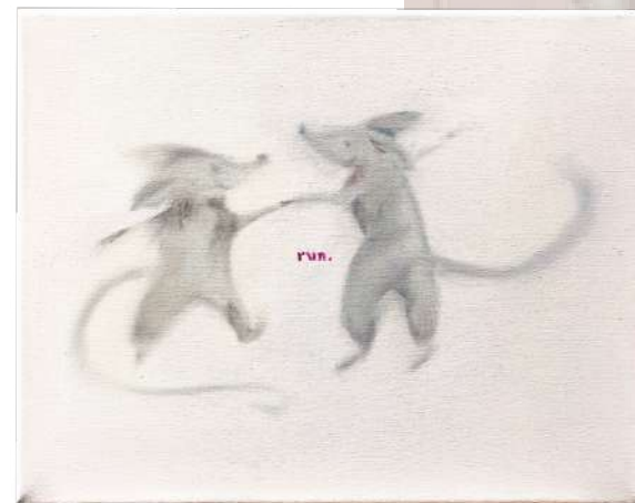
run. , 2023 huile sur toile, 24x19 cm