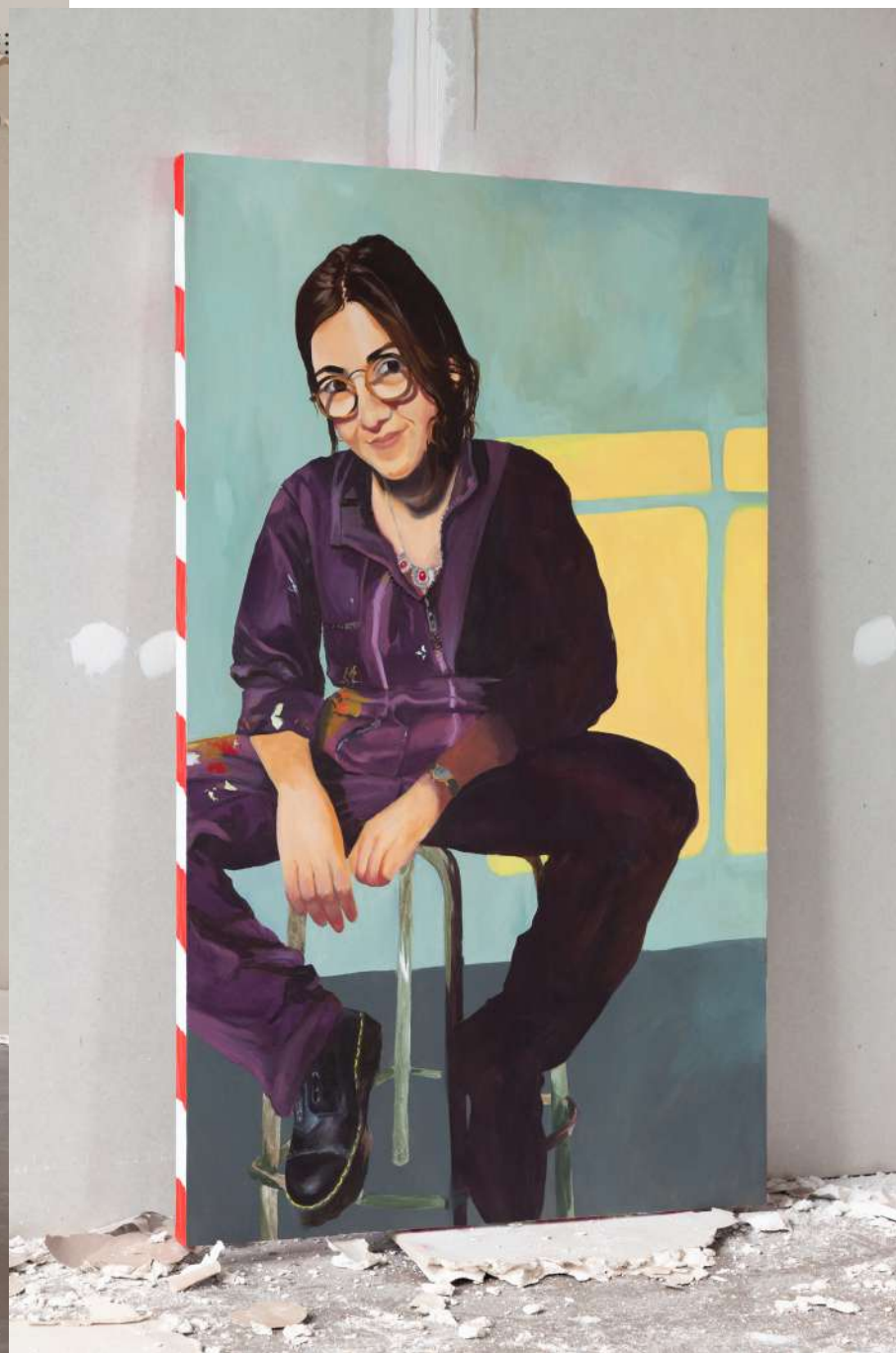
Joconde.btp (autopotrait) , 2022 huile sur toile, 125x75x4cm