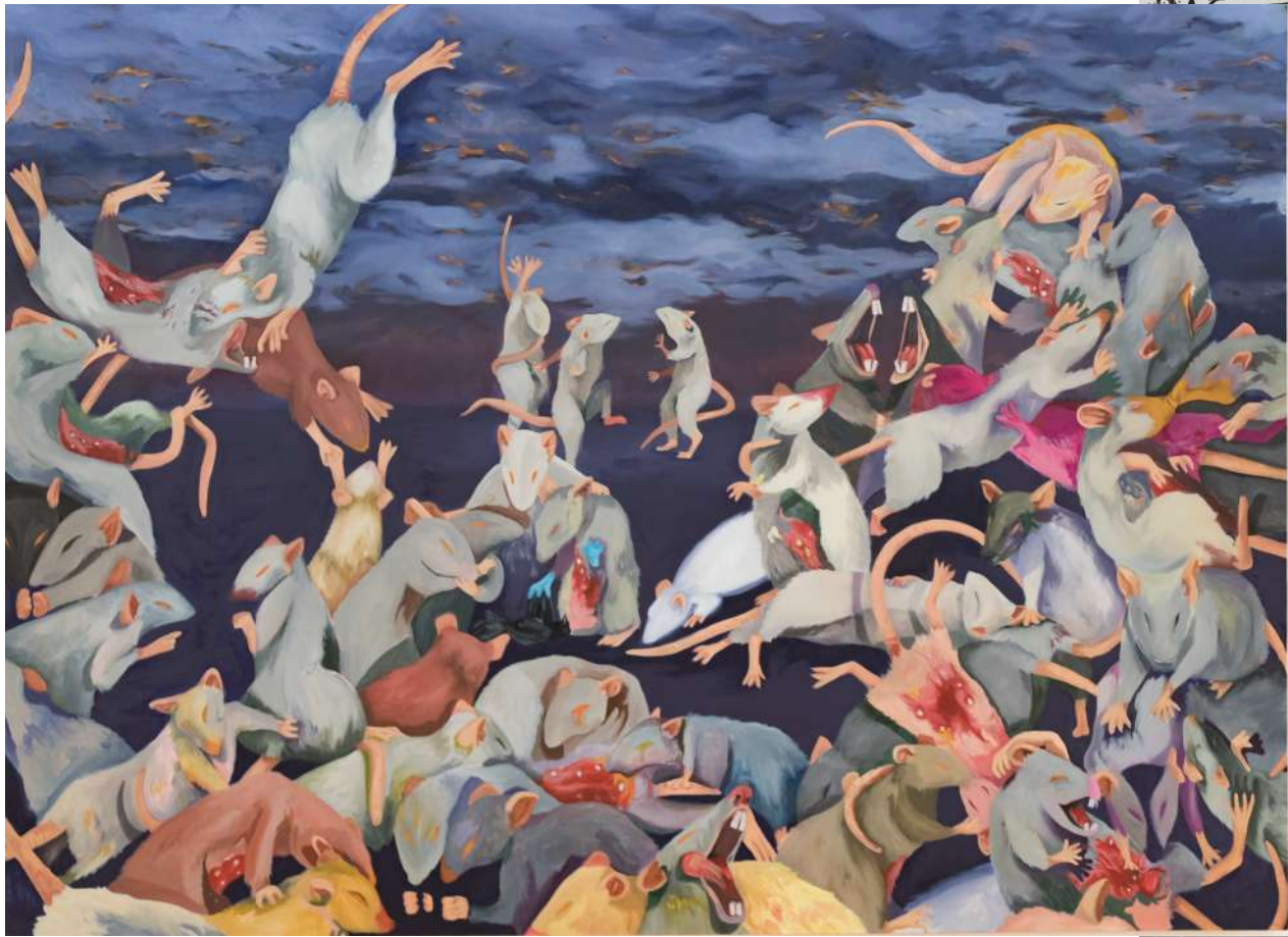
Sabbat , 2022 huile sur toile sur châssis, 180x150x4cm