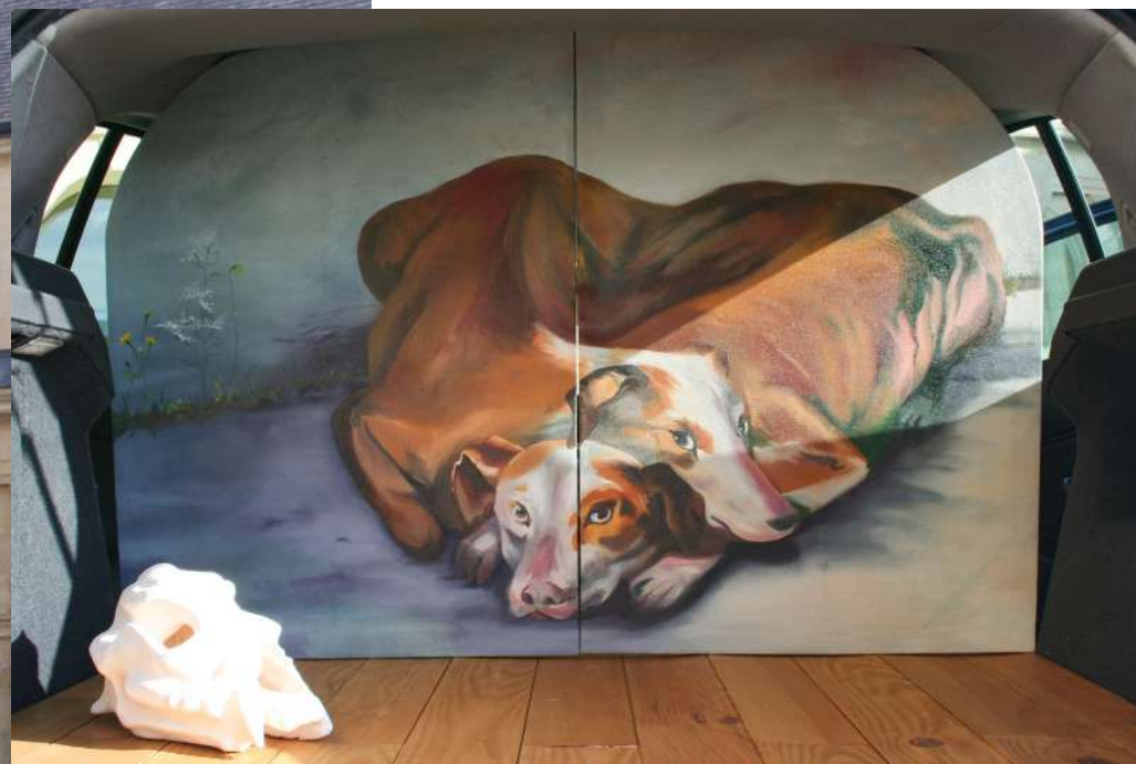
La troisième tête , 2023 huile sur toile, céramique, bois Opel Astra