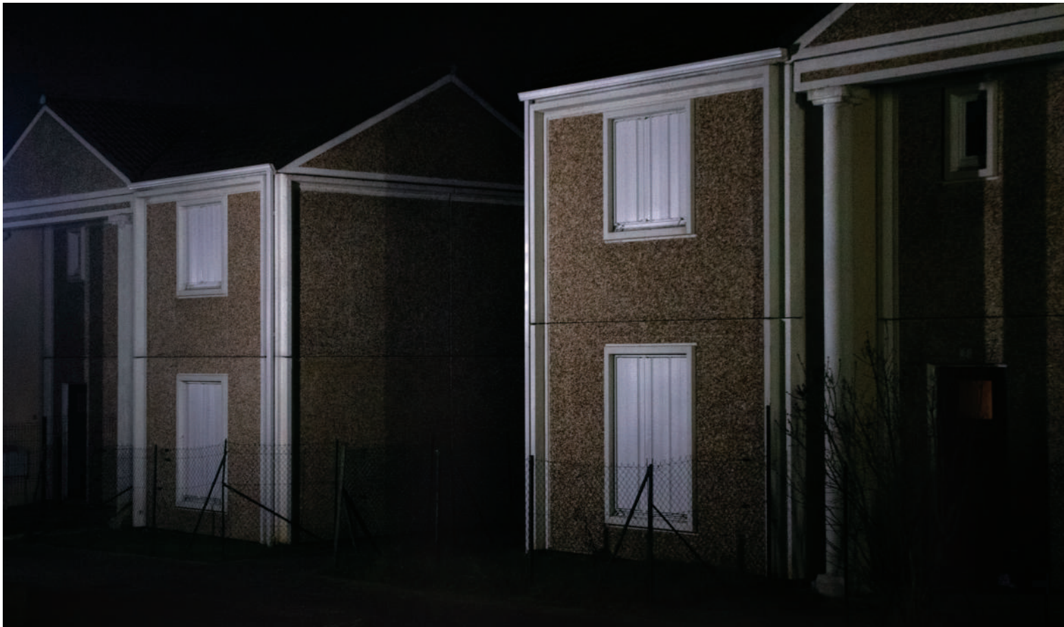
Val-de-Reuil, 2019, photographie.

Tout en me détachant de dispositifs documentaires, pour réaliser mes films, je m'appuie sur des situations réelles ainsi que des témoignages individuels et collectifs. Je cherche ainsi à percevoir comment ces discours et ces représentations impactent notre rapport au réel et à l'altérité.