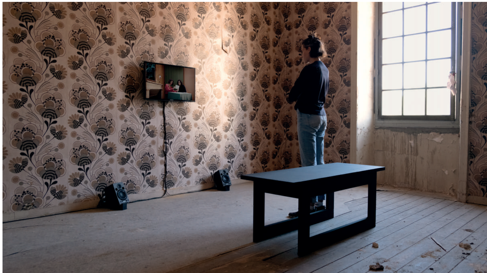
Vue de l'installation de Protocole n°44 , dans trois pièces différentes du bâtiment n°22 du Théâtre des Substances, juin 2022. 3 écrans / 3 bancs / 6 enceintes.

Le numéro de chaque épisode de Protocole correspond à celui du binôme lors du casting. Ainsi, ces films intègrent volontairement leur réalité de production à leur récit, de manière à ce que les deux deviennent complètement interdépendants.