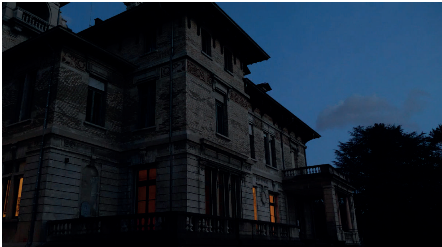
Vue de la Villa Gillet à Lyon, durant la résidence de création de Listen to the house , février 2021.