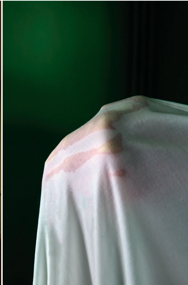
1. Édition de 21 tirages, 30x55cm, 2022 photographiée au bâtiment 22 du théâtre des Subsistances à Lyon.