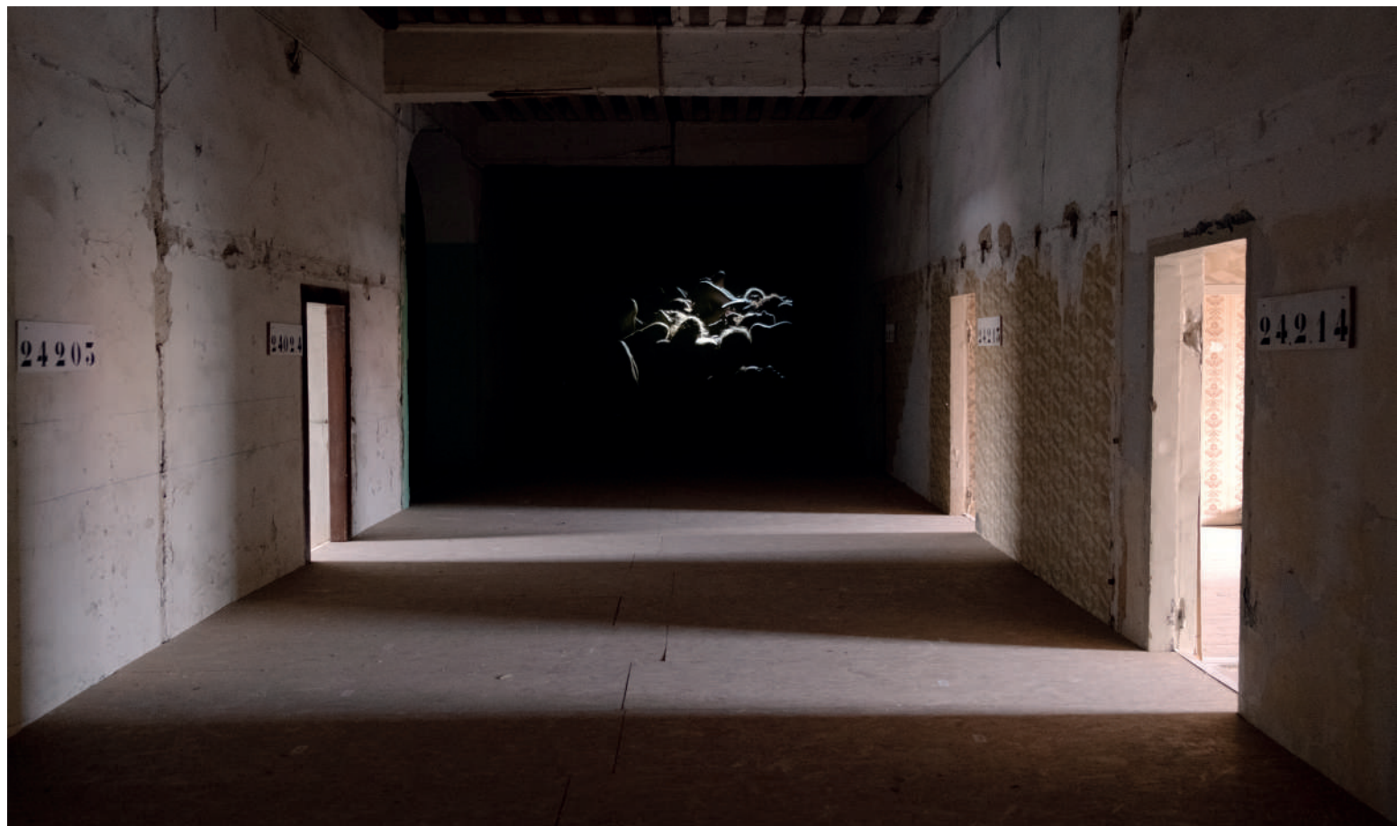
Installation de TEAM SPIRIT réalisée dans le bâtiment 22 du Théâtre des Subsistances, DNSEP ENSBA de Lyon, juin 2022. 1 écran suspendu de 400cm x 250cm, 1 projecteur, 1 ampli, 2 enceintes.

Une équipe sportive éclairée par de puissants projecteurs s'entraîne dans un espace vaste et sombre. Leurs corps s'y confrontent, s'y soutiennent et s'y effondrent collectivement. Les bruits des cris, gestes, souffles et chutes se mêlent dans l'espace sonore jusqu'à ne plus former qu'un seul et même organisme bruyant. Un corps collectif, à la fois discipliné et solidaire, dans lequel chaque individu s'efface au profit de la structure fragile et informe du groupe.