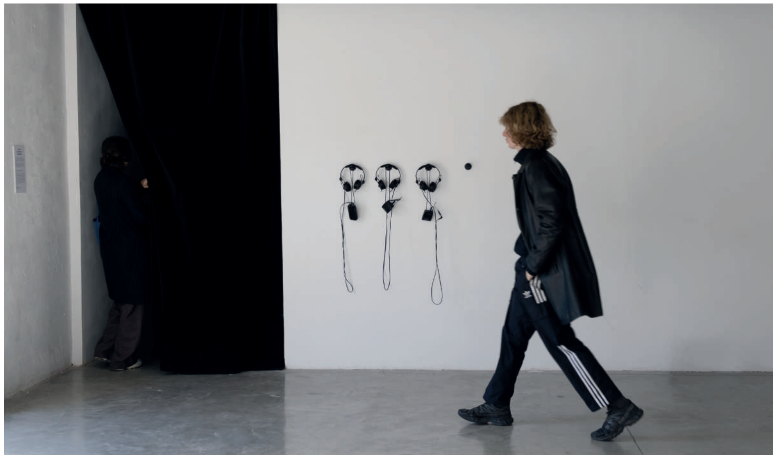
Vue de l'installation Posez vos mains sur son corps , pour Prix Linossier en septembre 2022, ENSBA de Lyon. 1 vidéoprojecteur / 4 casques / 4 moniteurs HF / 1 carte son / 2 bancs.

Celui-ci provient de l'exposition L'art et la matière, prière de toucher créée par les musées des beaux-arts de Lyon, Nantes, Lille, Rouen et Bordeaux en 2021. Ainsi détourné, remonté et rejoué, l'audioguide décrit désormais spécifiquement l'expérience tactile supposée des spectateurs touchant les corps sculptés féminins. En l'absence des œuvres elles-mêmes, les mots et expressions choisis pour les décrire mettent en évidence, malgré eux, la manière dont les canons esthétiques issues de l'histoire de l'art occidental imprègnent toujours aujourd'hui notre perception des corps. L'installation est constituée d'une projection et de plusieurs audioguides à disposition des spectateurs.