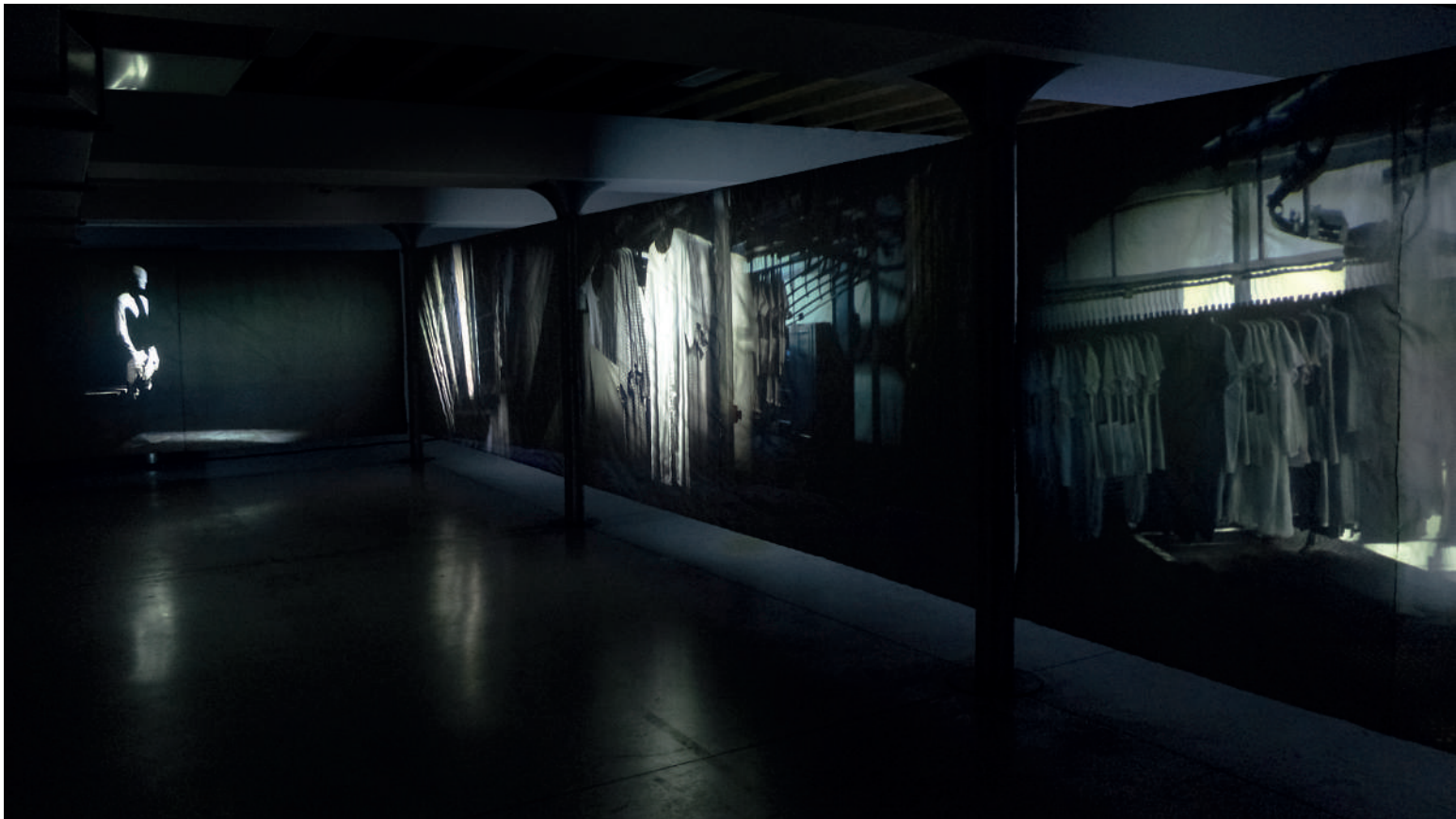
Vue de l'installation de La Machine à influencer pour le Prix de Paris, septembre 2022, ENSBA de Lyon. 4 écrans, 4 vidéoprojecteurs, 2 enceintes, 1 caisson de basse, 1 ampli.

Judith Butler, Bodies that Matter, on the Discursive Limits of «Sex» , [1993], New York, Routledge Classics, 2011, p. 12-24.