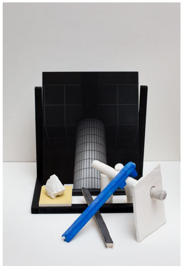
Amphibæna, Le Marcheur à deux têtes (2022). Vues d'exposition + visuel — Typologie d'une architecture ressentie (2017), grès + bois + photographie