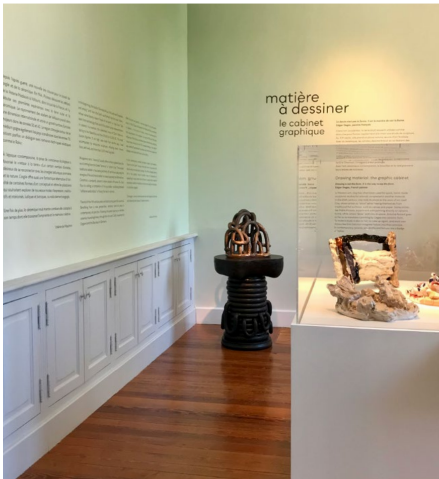
Barocco e piedistallo, 2022 Grès émaillé, 117 x 60 x 50 cm + vue de l'exposition Toucher Terre , Villa Datriis, 2022