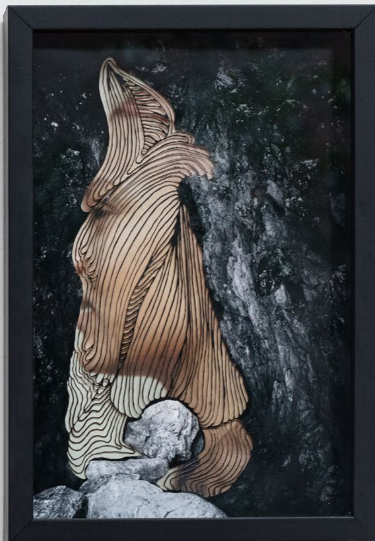
Gorgones, 2022 Collage, photographies décou- pées, 20 x 30 cm.