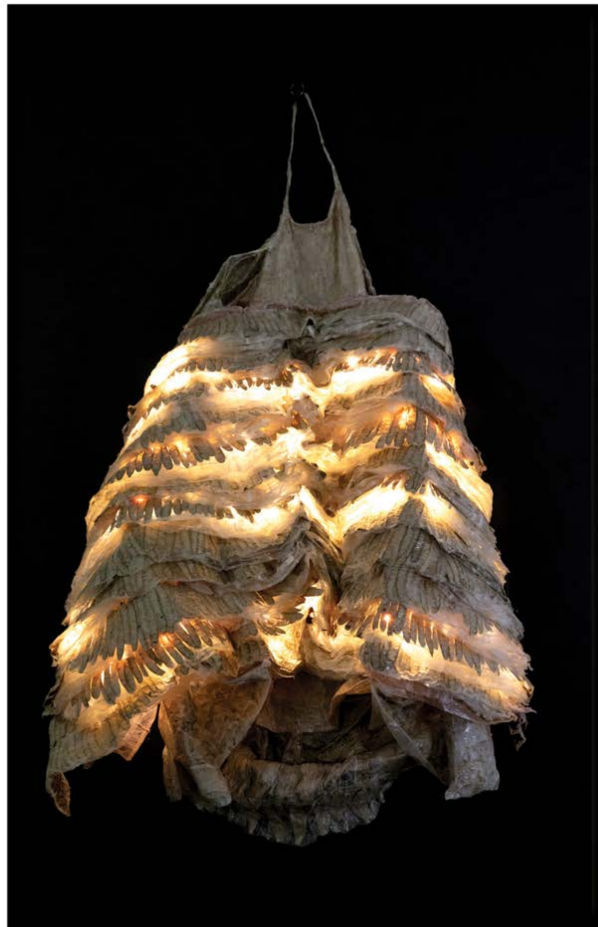
Chrysalide n° 18, dispositif sculptural mural 122 x 80 cm, composé d'une sculpture en résine 95 x 65 x 35 cm, panneau et éclairage