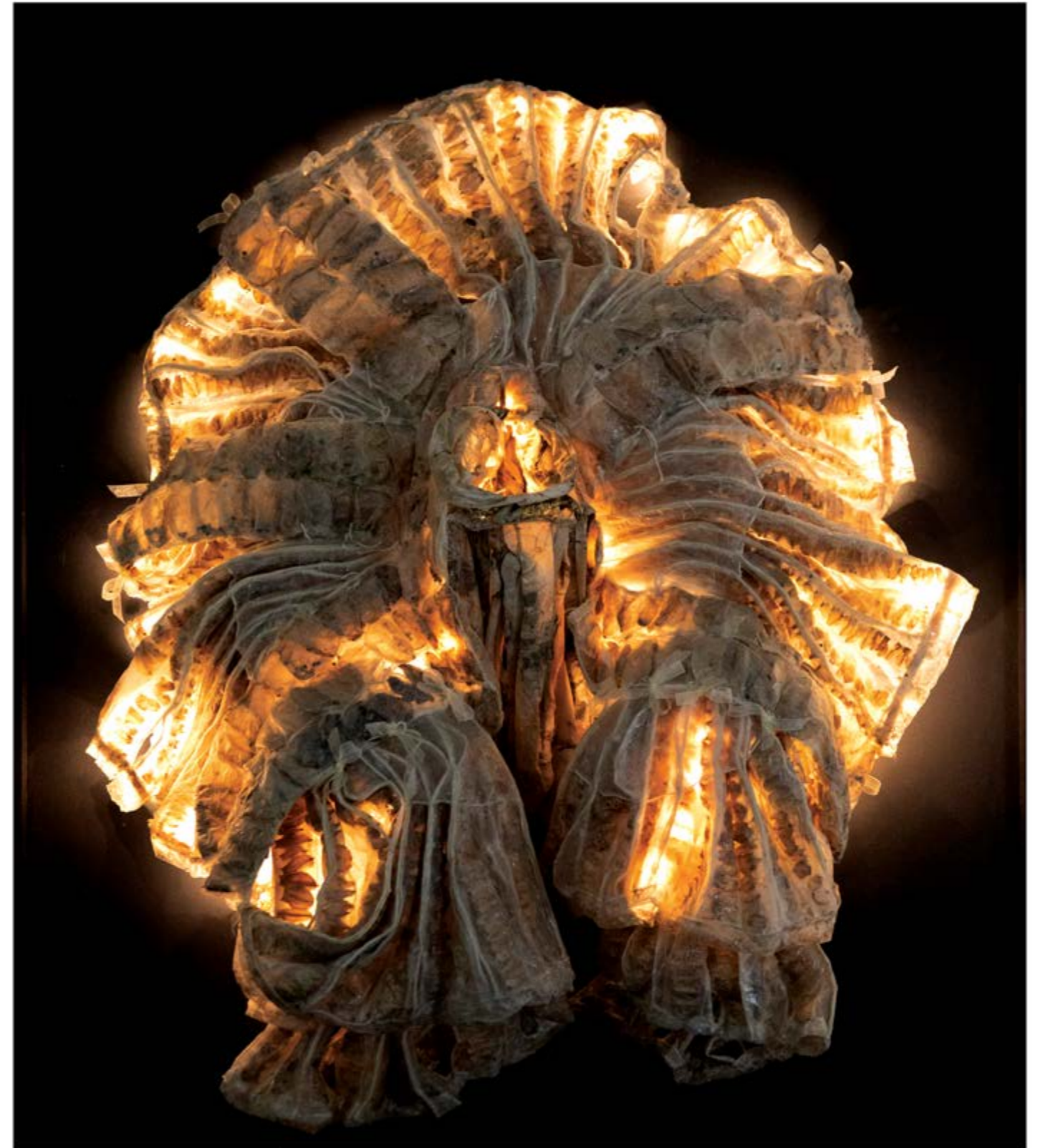
Chrysalide n° 17, dispositif sculptural mural 100 x 85 cm, composé d'une sculpture en résine 80 x 80 x 40 cm, panneau et éclairage