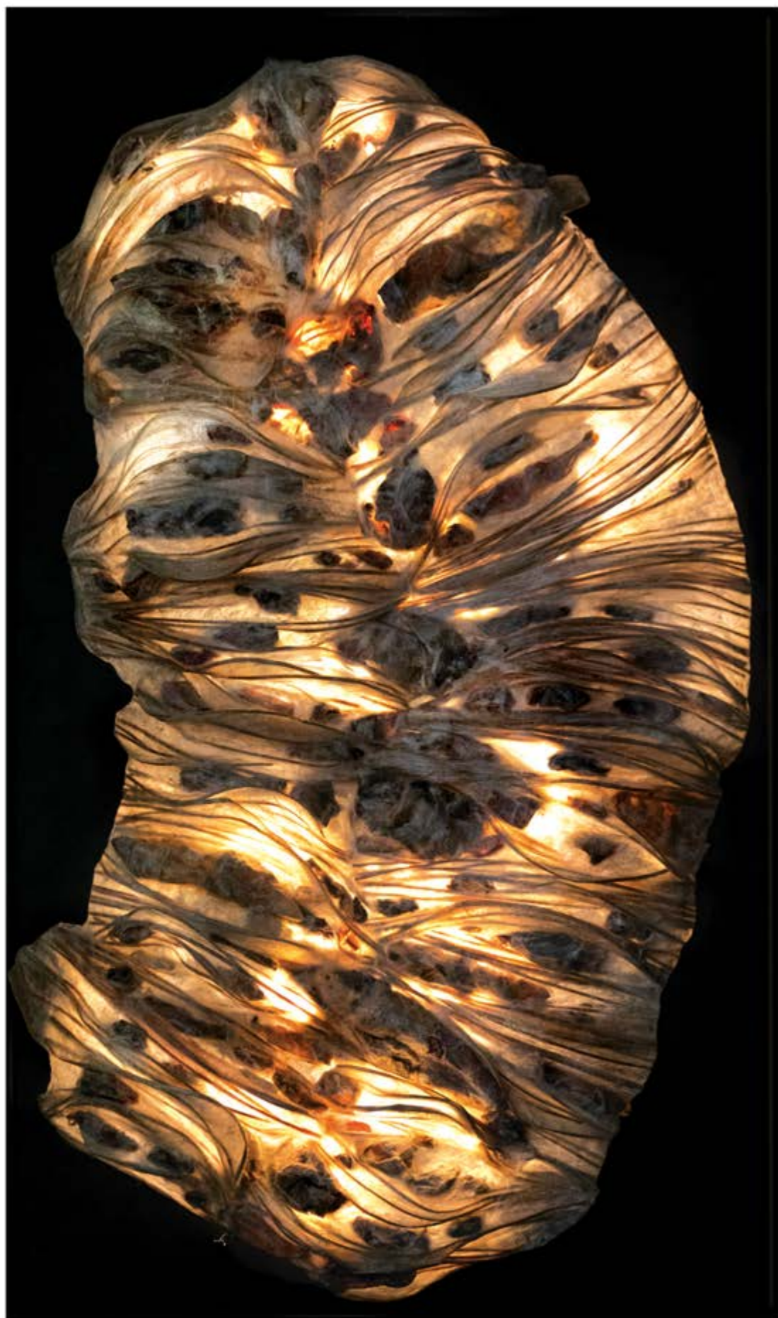
Chrysalide n° 3, dispositif sculptural mural 177 x 102 cm, composé d'une sculpture en résine 155 x 90 x 20 cm, panneau et éclairage