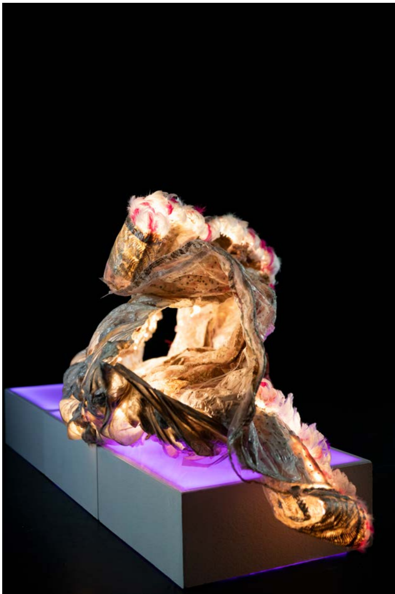
Nymphose n° 2, dispositif sculptural modulaire 80 x 180 x 90 cm, composé de 3 sculptures en résine, socle et éclairage