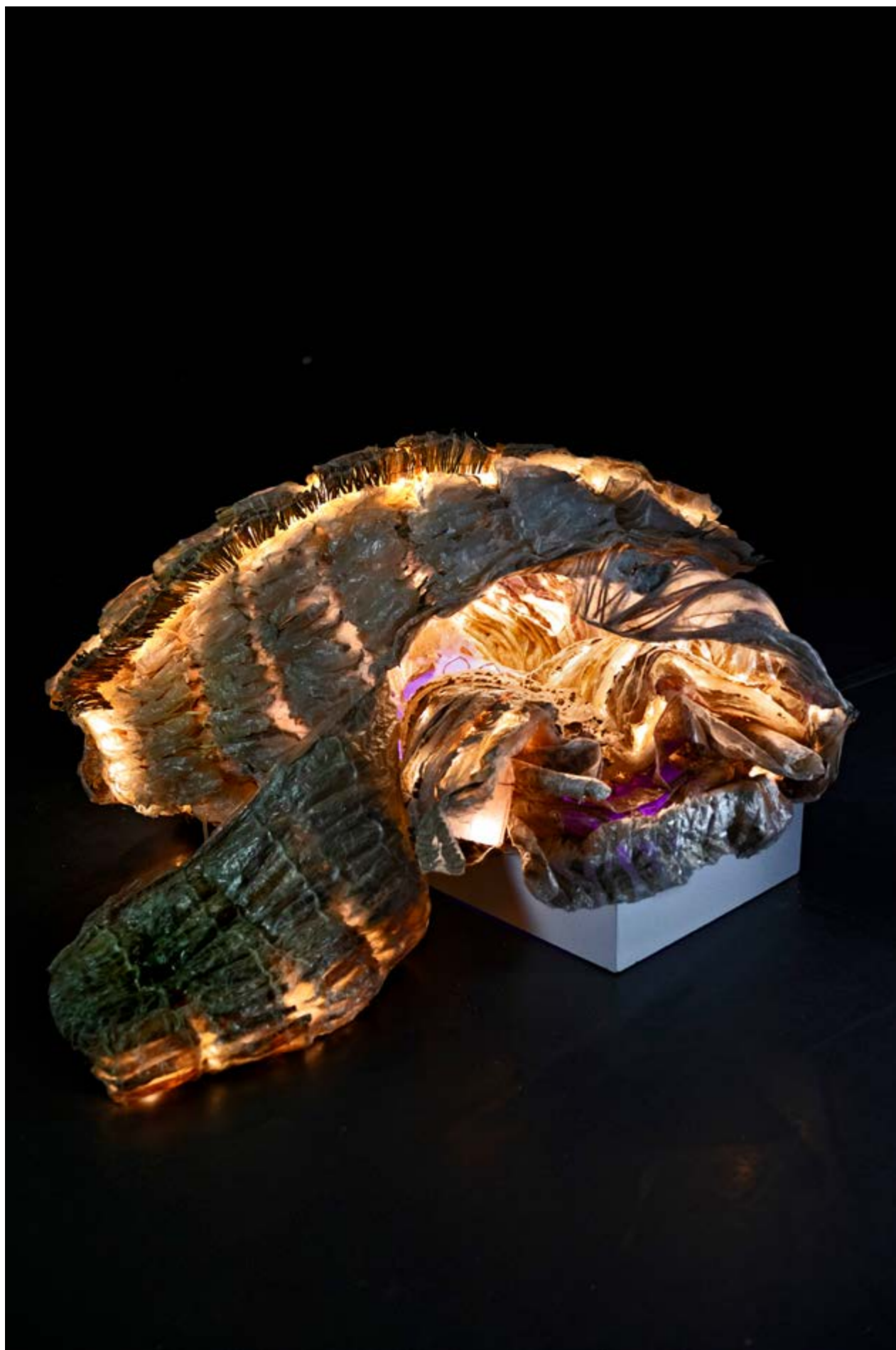
Nymphose n° 4, dispositif sculptural modulaire 75 x 170 x 160 cm, composé de 4 sculptures en résine, socle et éclairage