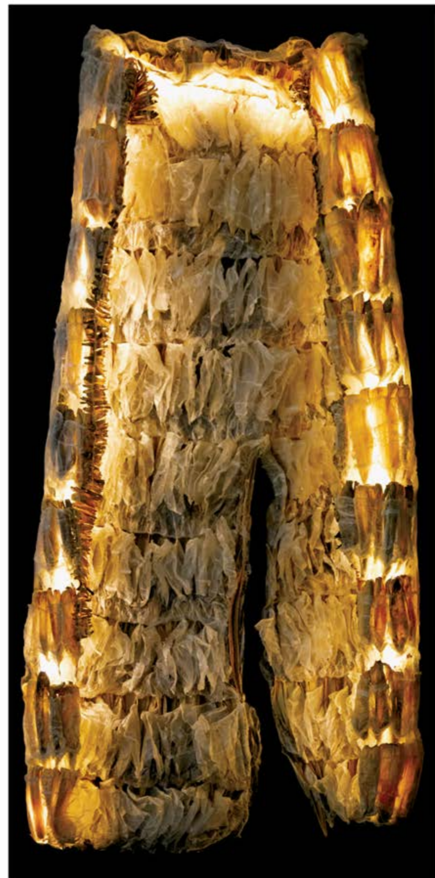
Chrysalide n° 11, dispositif sculptural mural 165 x 80 cm, composé d'une sculpture en résine 160 x 75 x 25 cm, panneau et éclairage