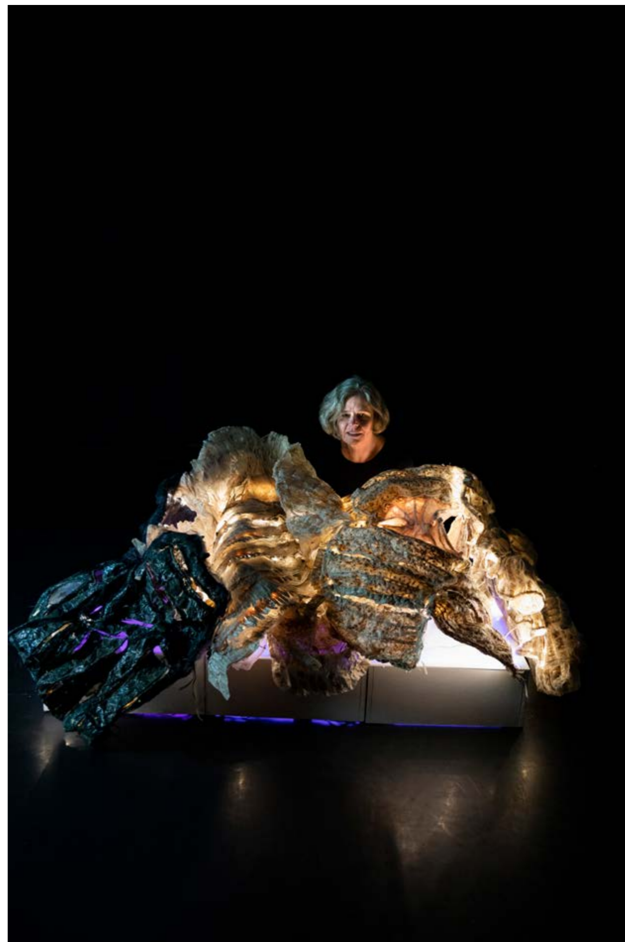
Nymphose n° 3, dispositif sculptural modulaire 80 x 180 x 100 cm, composé de 5 sculptures en résine, socle et éclairage