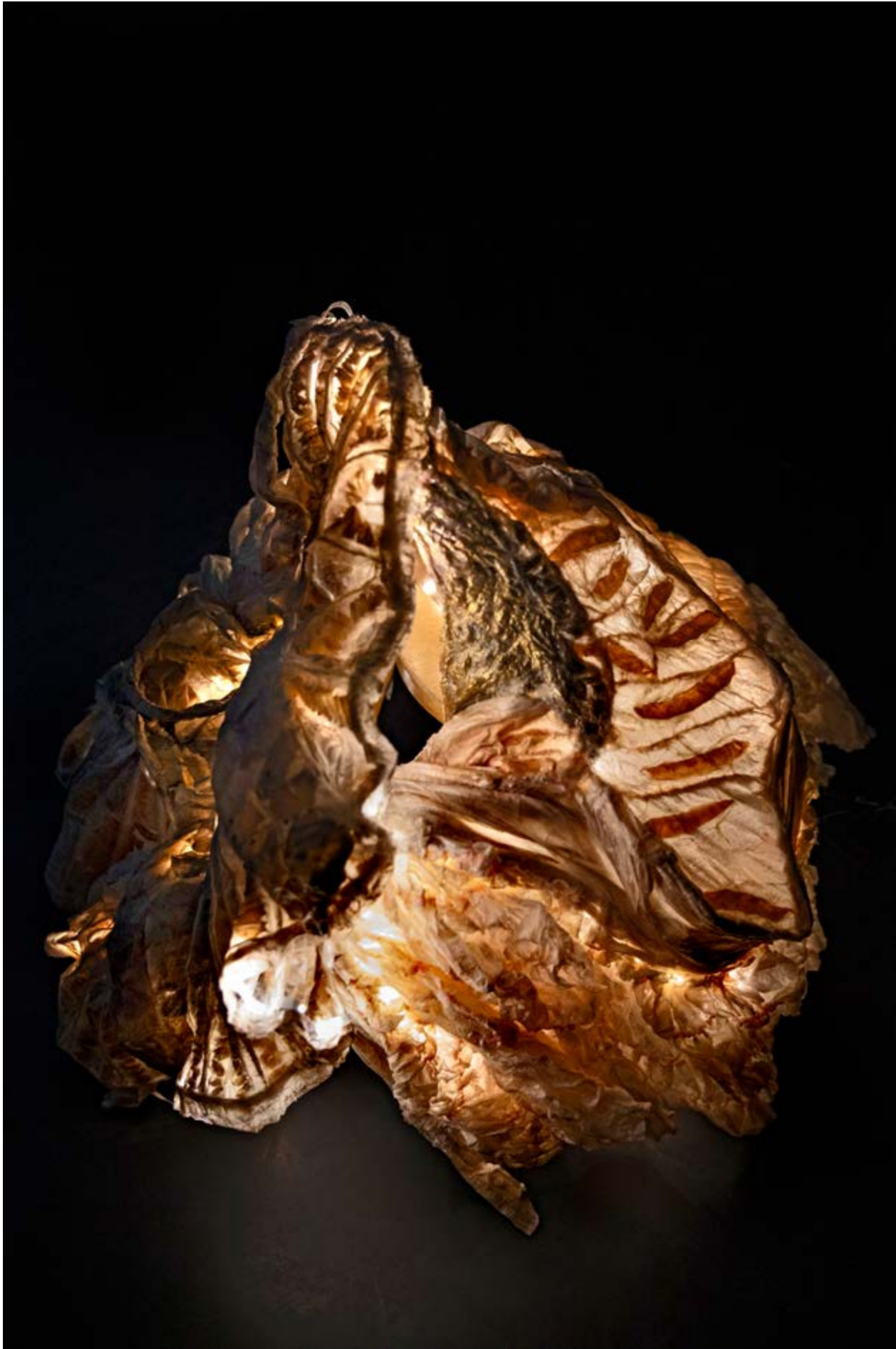
Nymphose n° 5, dispositif sculptural modulaire 70 x 70 x 100 cm, composé de 2 sculptures en résine, chaise et éclairage