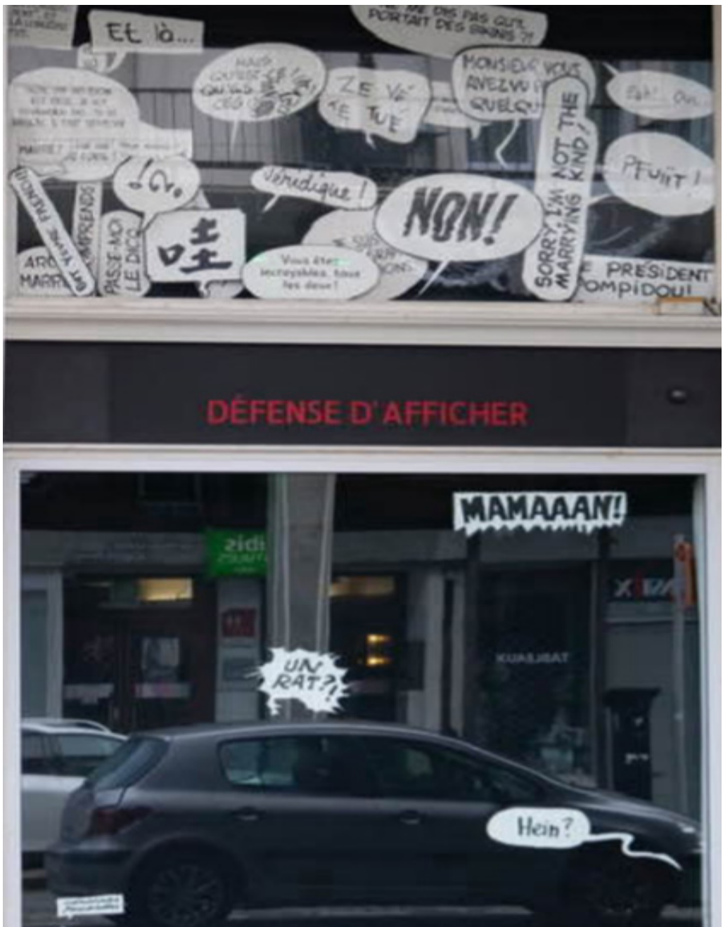
Titre : Wall-street Date : 2019 Technique.s : Découpe & peinture sur bois Format : Variables Commentaires :

Mise en espace d'une collection de phylactères dans une vitrine. Ces bulles ont été sélectionnées dans de nombreux ouvrages et par quelques élèves durant un work-shop. Une sorte d'interaction avec les passants se déploie.