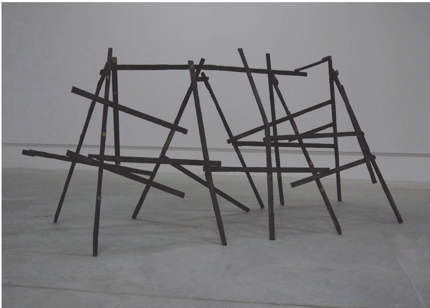
Précaire#1 sculpture bois carbonisé, clous structure à dimensions variables 2017