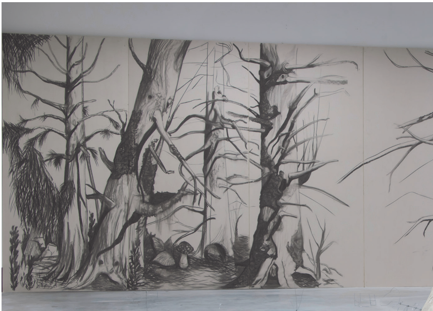
Forêt noire dessin fusain, placoplatre 750x280cm 2018