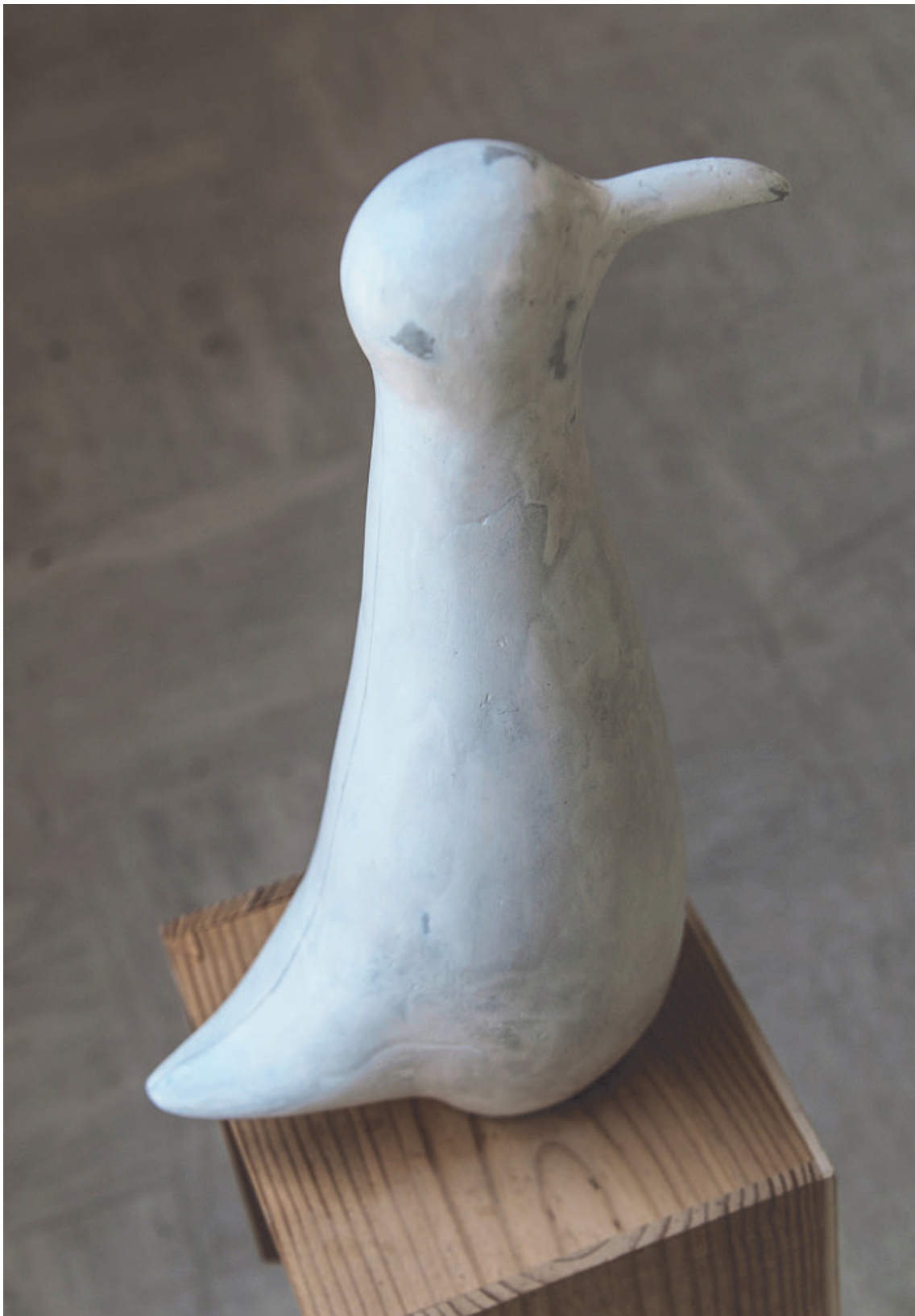
Pingoo sculpture scotch, papier maché, platre, carton 43x28x12cm 2014