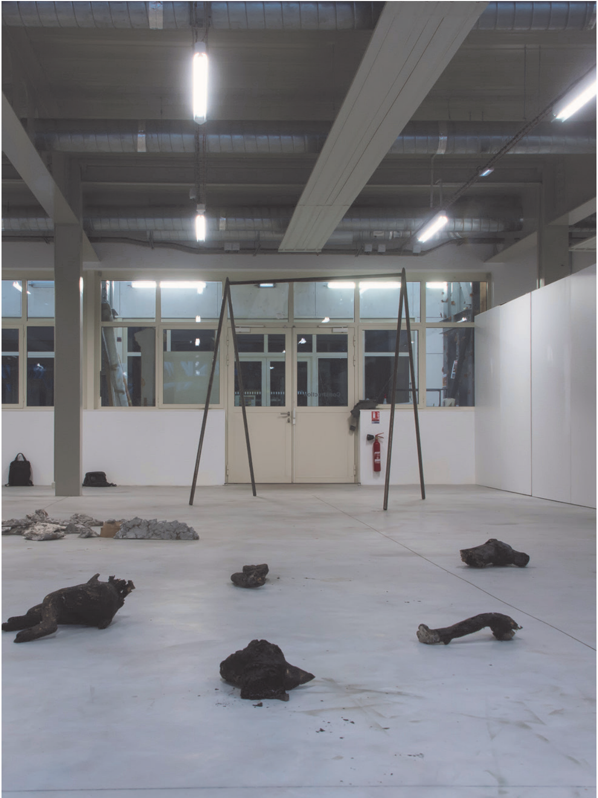
Structure #2 sculpture (vue d'exposition) Acier 280x100x200cm 2017