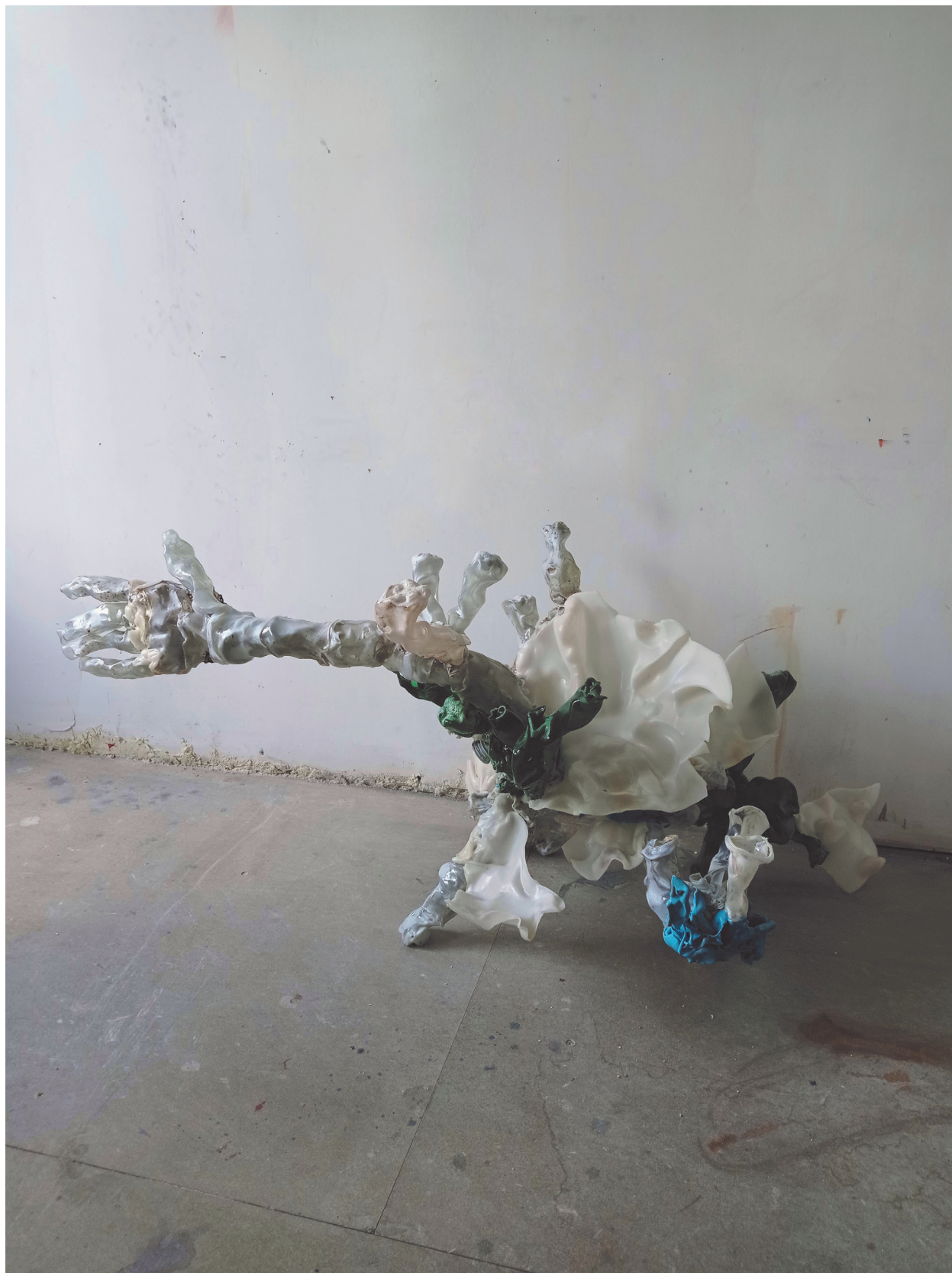
Plastique fantastique #3 dechets plastiques thermofusés 120x80x54cm 2021