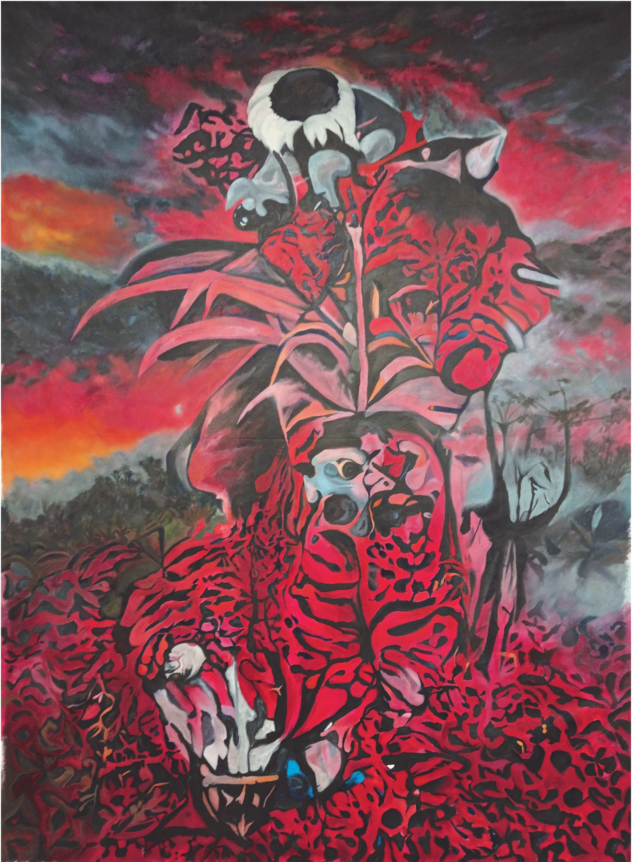
No pain no gain (titre temporaire) acrylique sur toile, vernis 240x160cm 2021