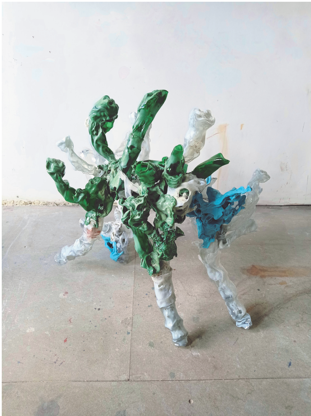
Plastique fantastique #2 dechets plastiques thermofusés, fil de fer 73x42x58cm 2021