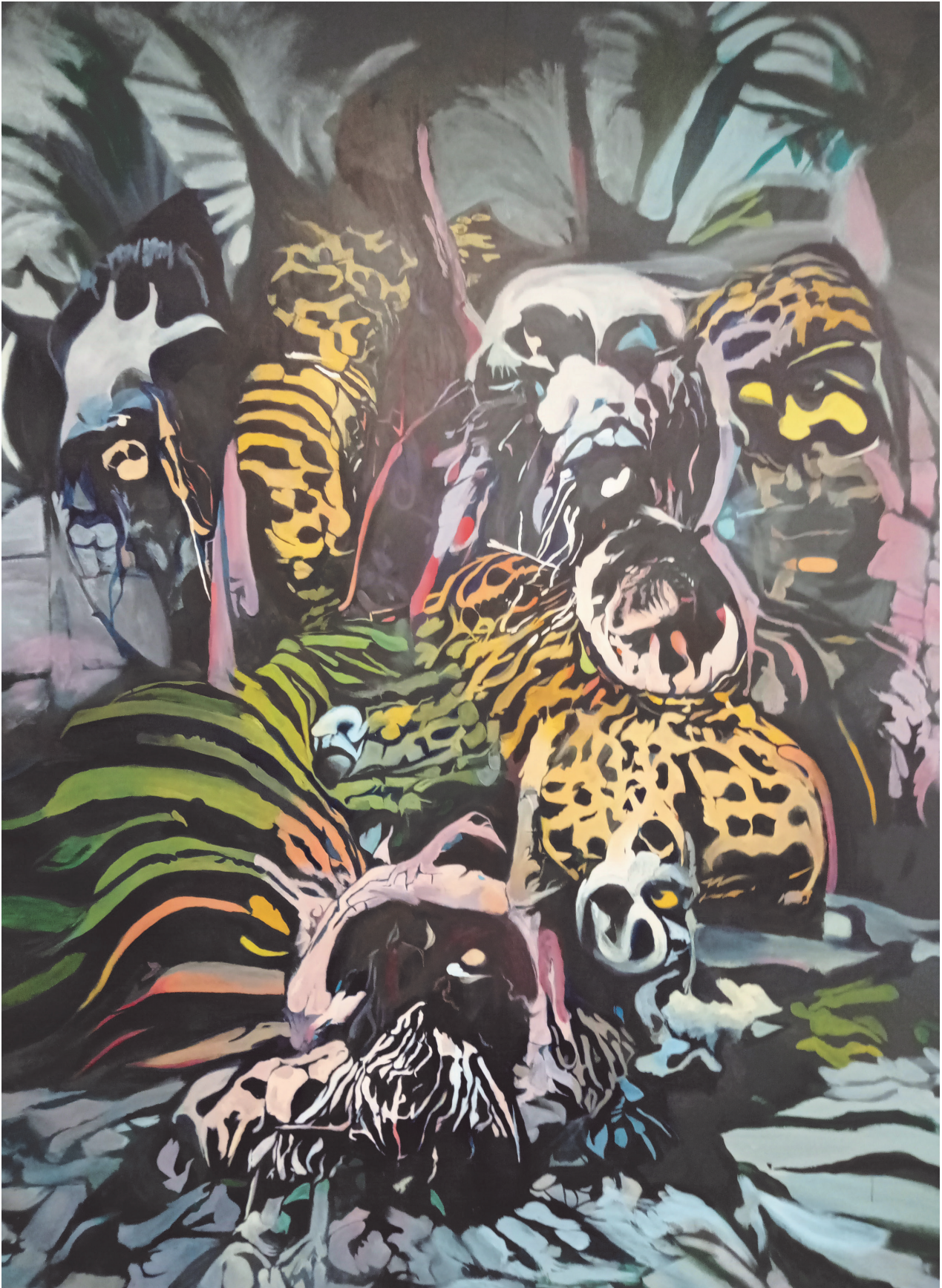
La fuite acrylique sur toile, vernis 240x160cm 2022