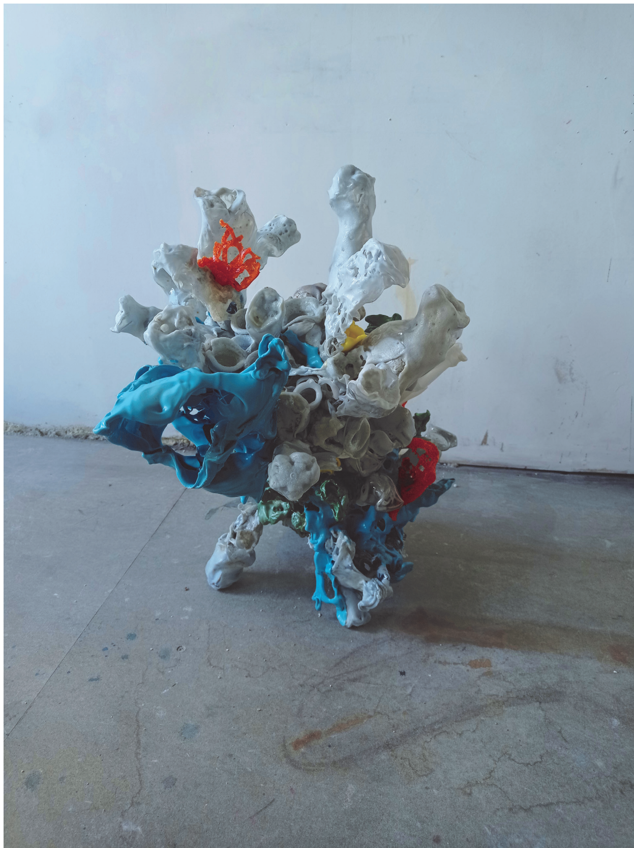
Plastique fantastique #1 dechets plastiques thermofusés, fil de fer 52x40x55cm 2021