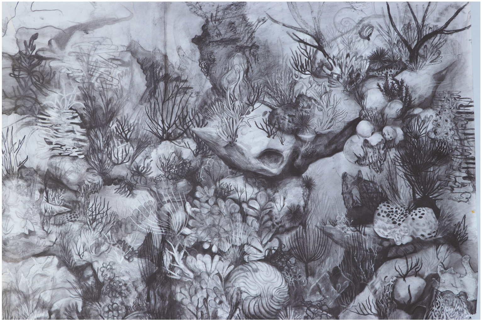
Saturne dessin fusain sur papier 280x220cm 2020