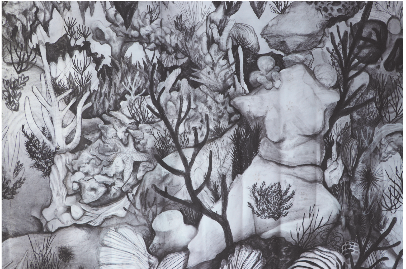
Vénus dessin fusain sur papier 280x220cm 2020