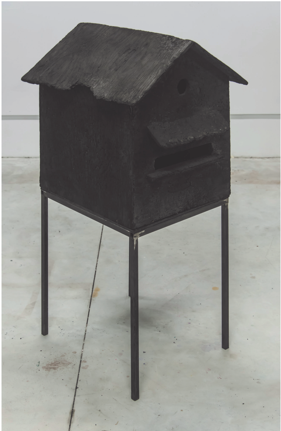
Brûlure lachée sculpture bois carbonisé, acier 60x55x 165cm 2017