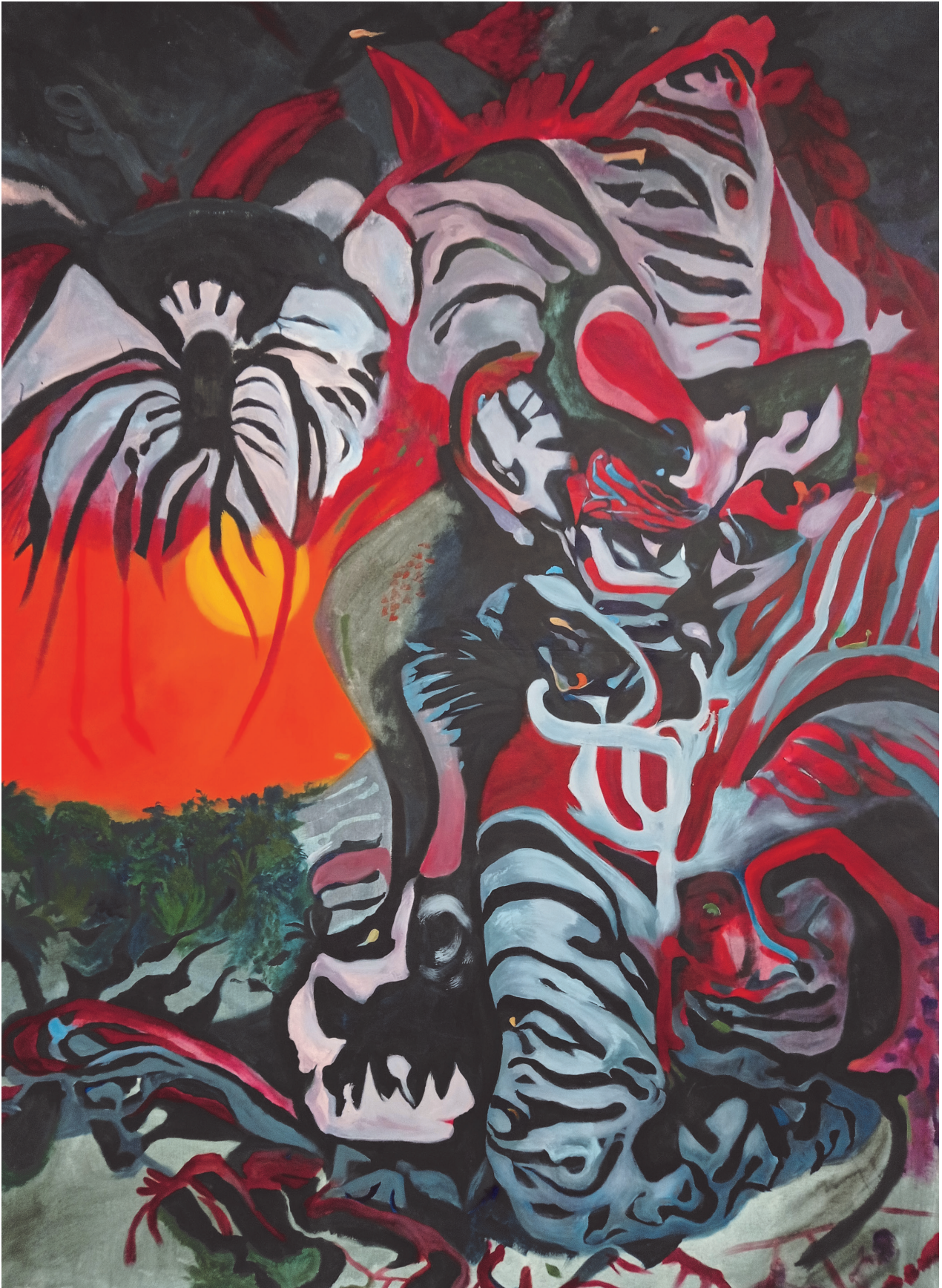
Mars (titre temporaire) acrylique sur toile, vernis 240x160cm 2022