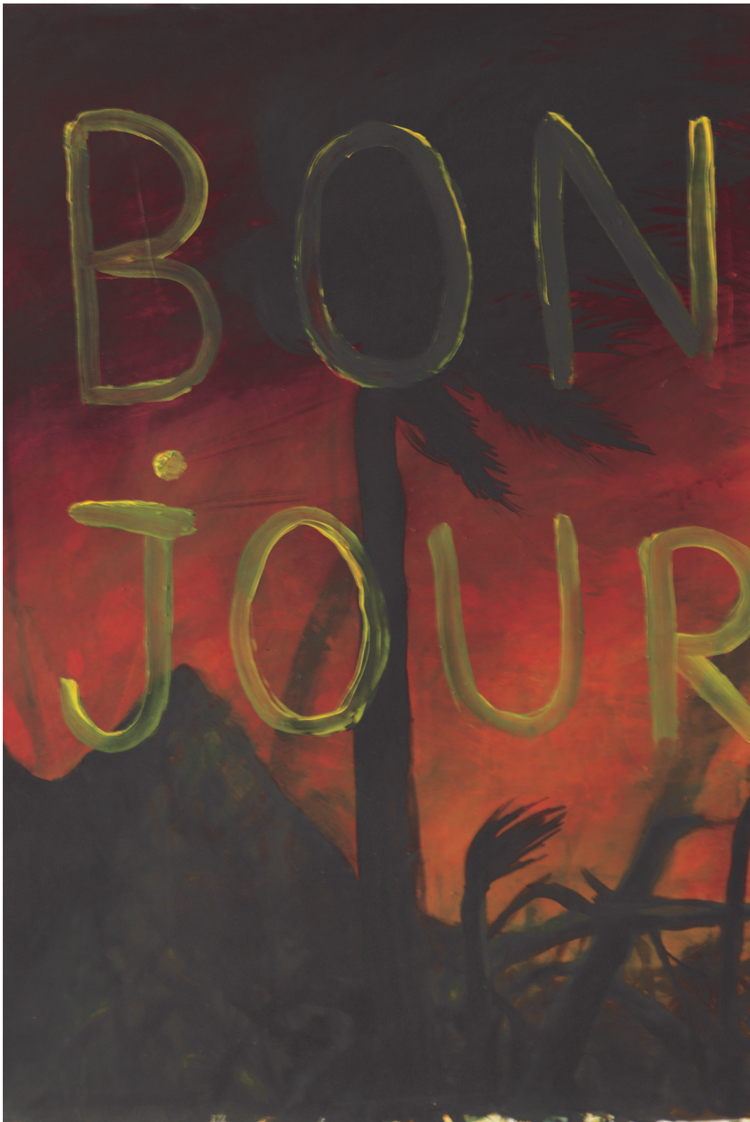
Bonjour acrylique sur papier 60x45cm 2019