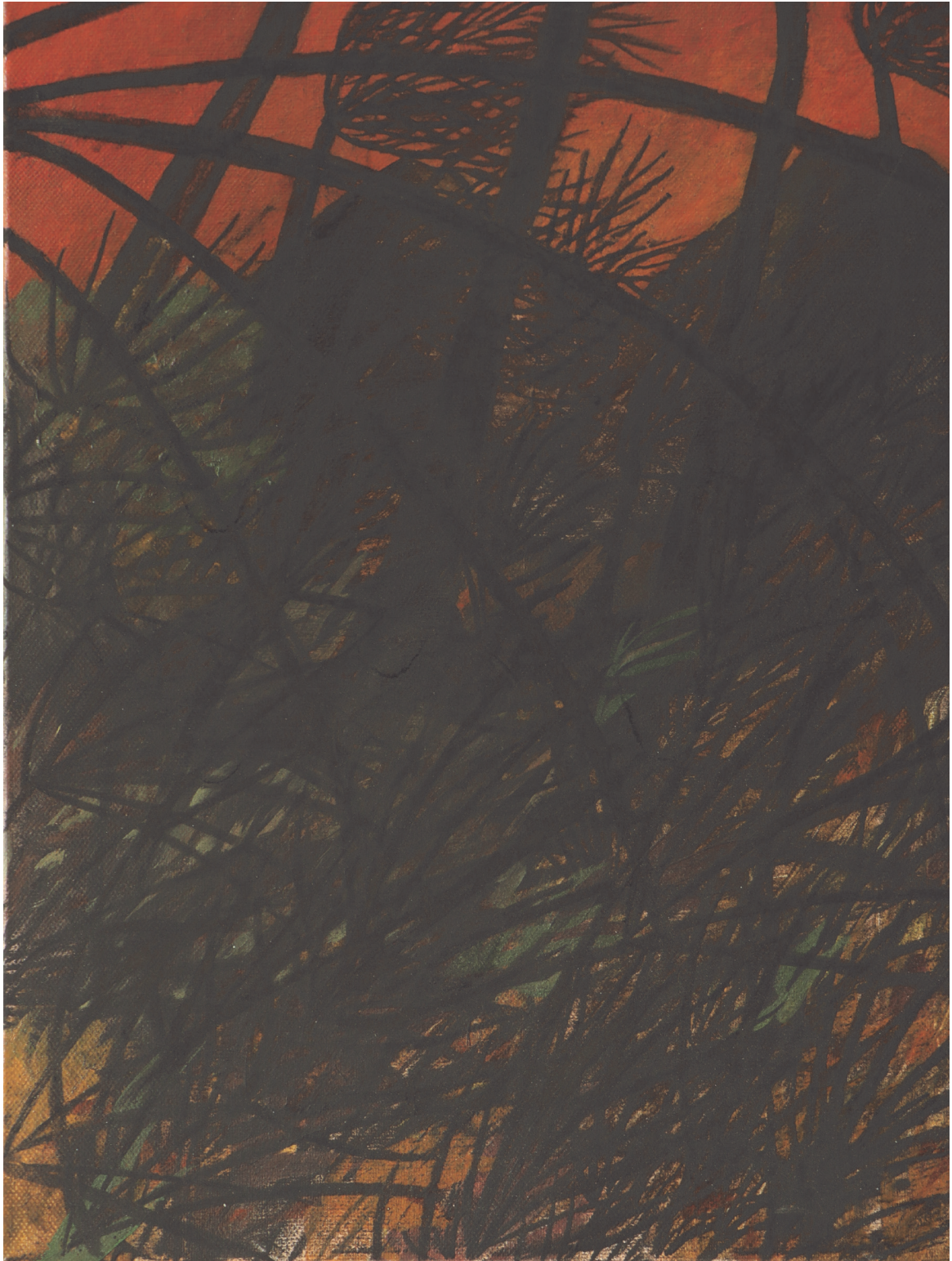
Amours épineuses (série en cours) acrylique, fusain et vernis sur toile 30x40cm 2020