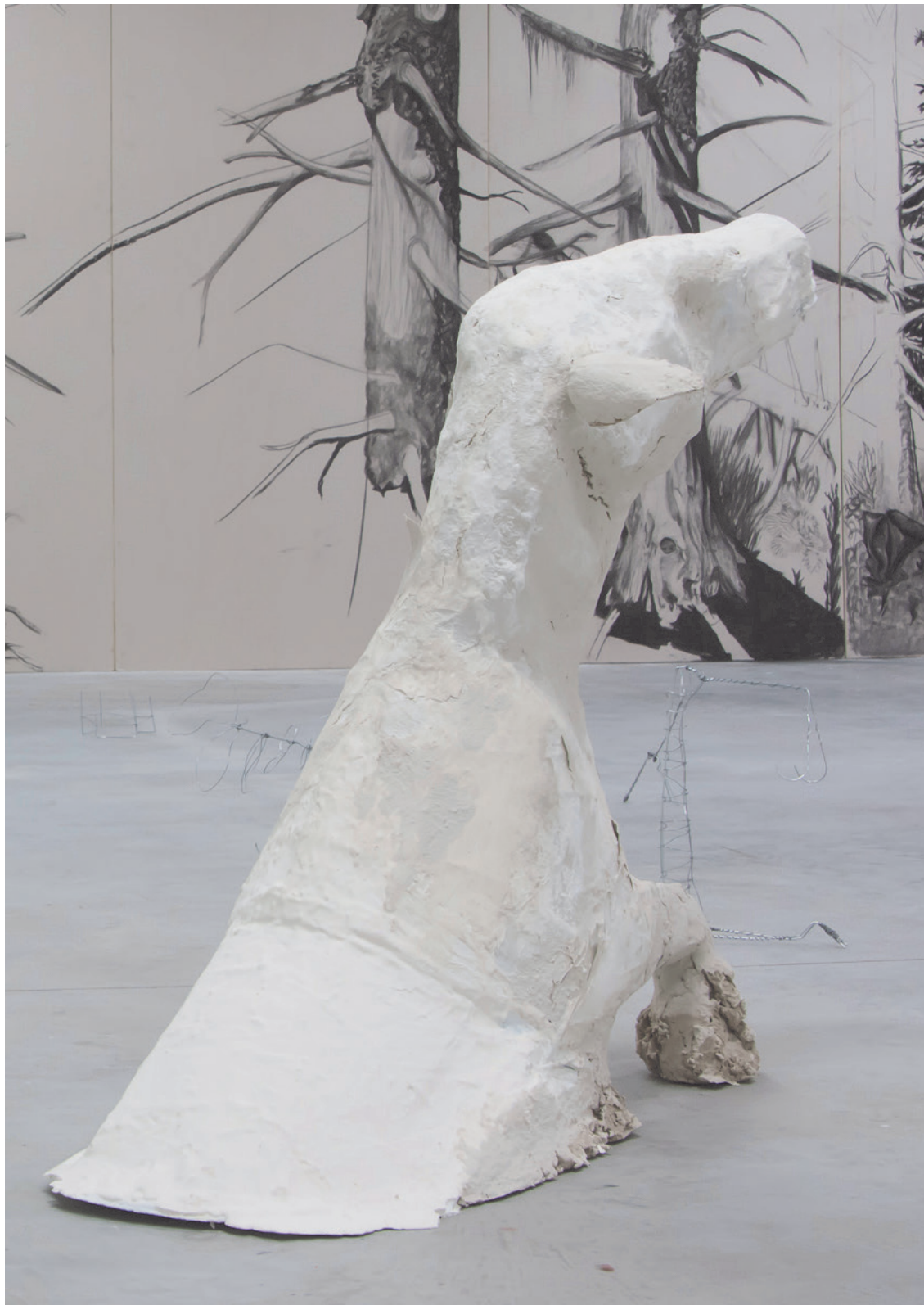
Blanc cheval enduit, plâtre, papier maché, carton, grillage 150x110x80cm 2018