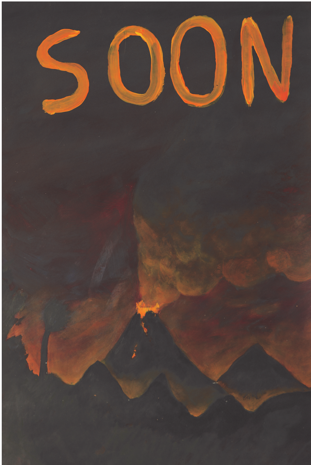
Soon acrylique sur papier 75x45cm 2019