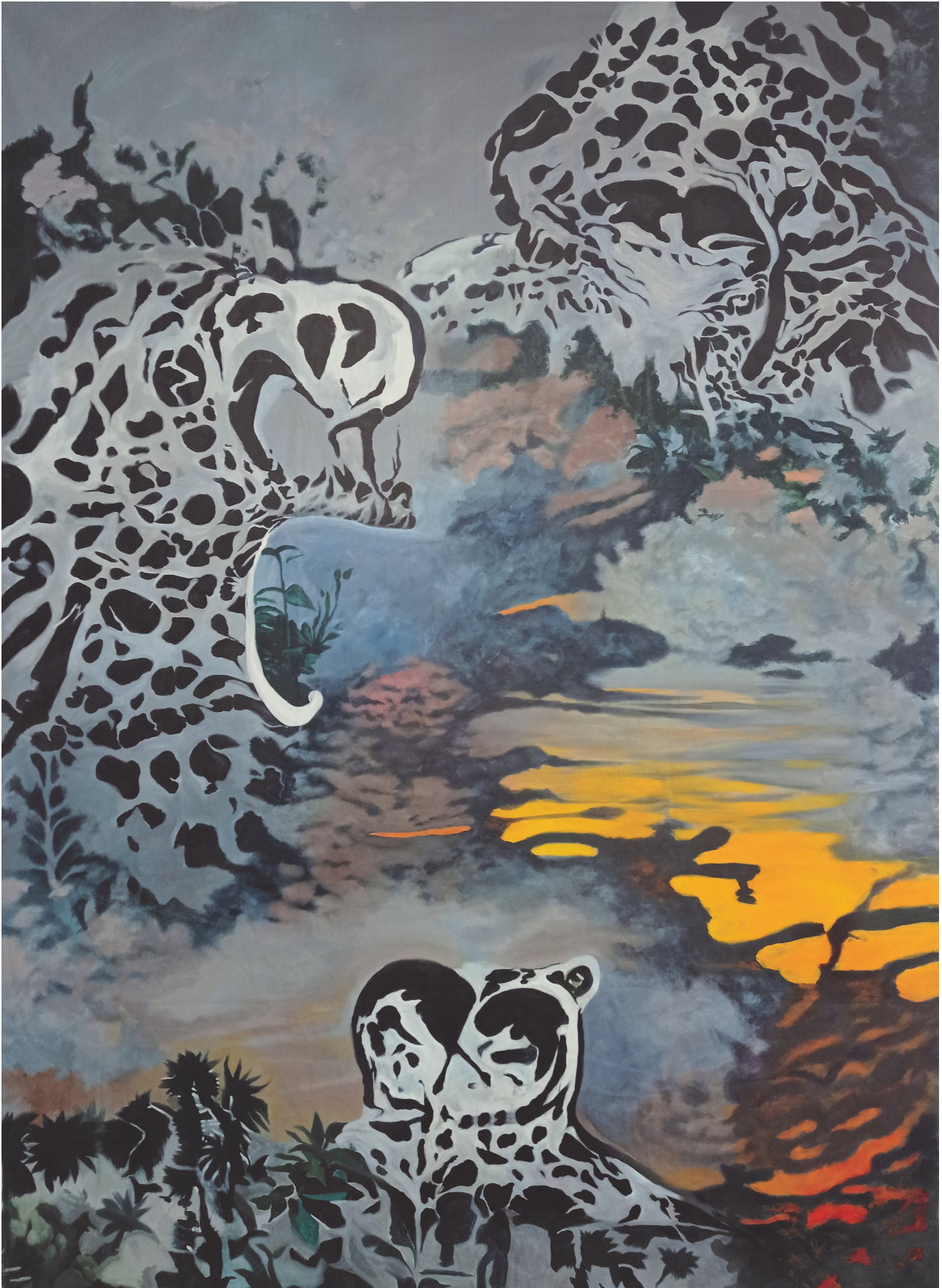
Dlmanche (titre temporaire) acrylique sur toile, vernis 240x160cm 2022