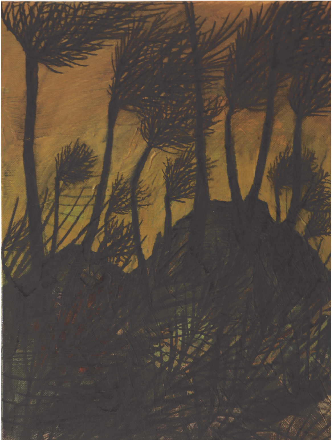
Amours épineuses (série en cours) acrylique, fusain et vernis sur toile 30x40cm 2020