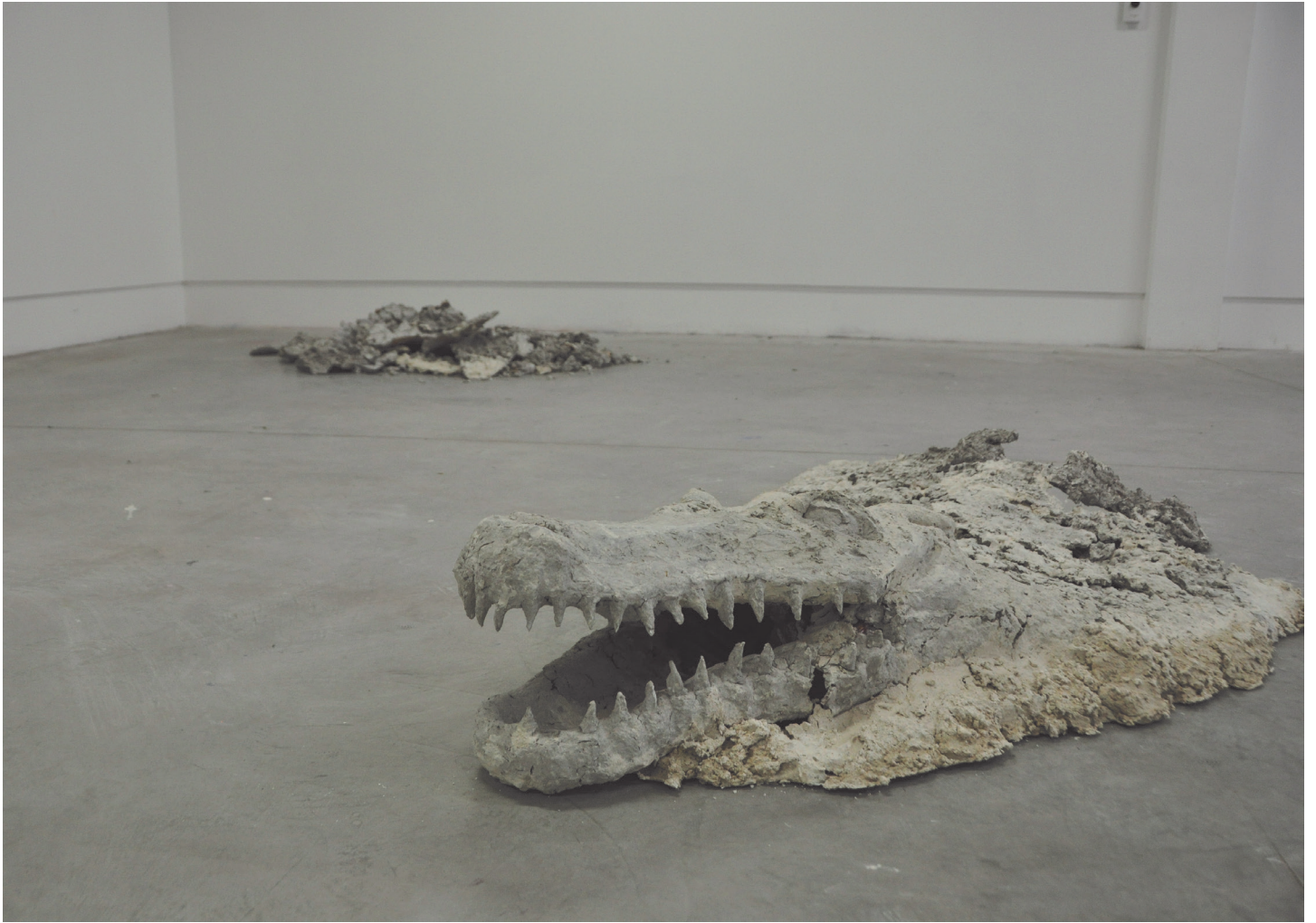
Roc docile sculpture (deux éléments) papier maché, plâtre, carton 150x120x45cm 2018