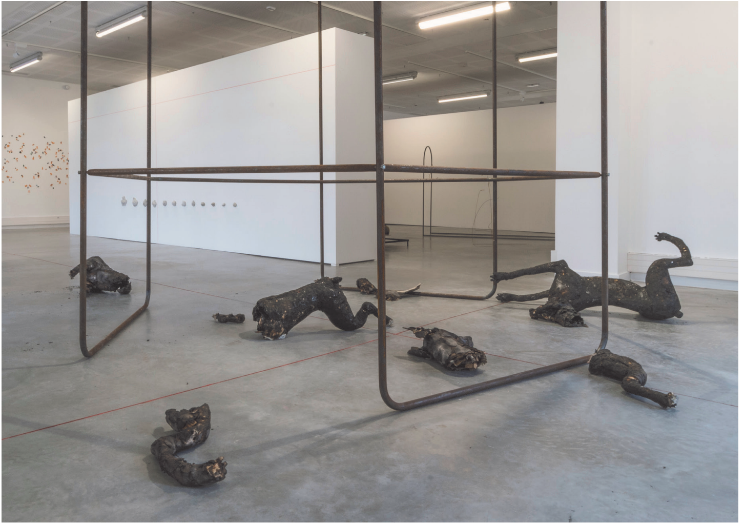
Structures #1 sculpture (vue d'exposition) Acier 280x300X300cm 2016