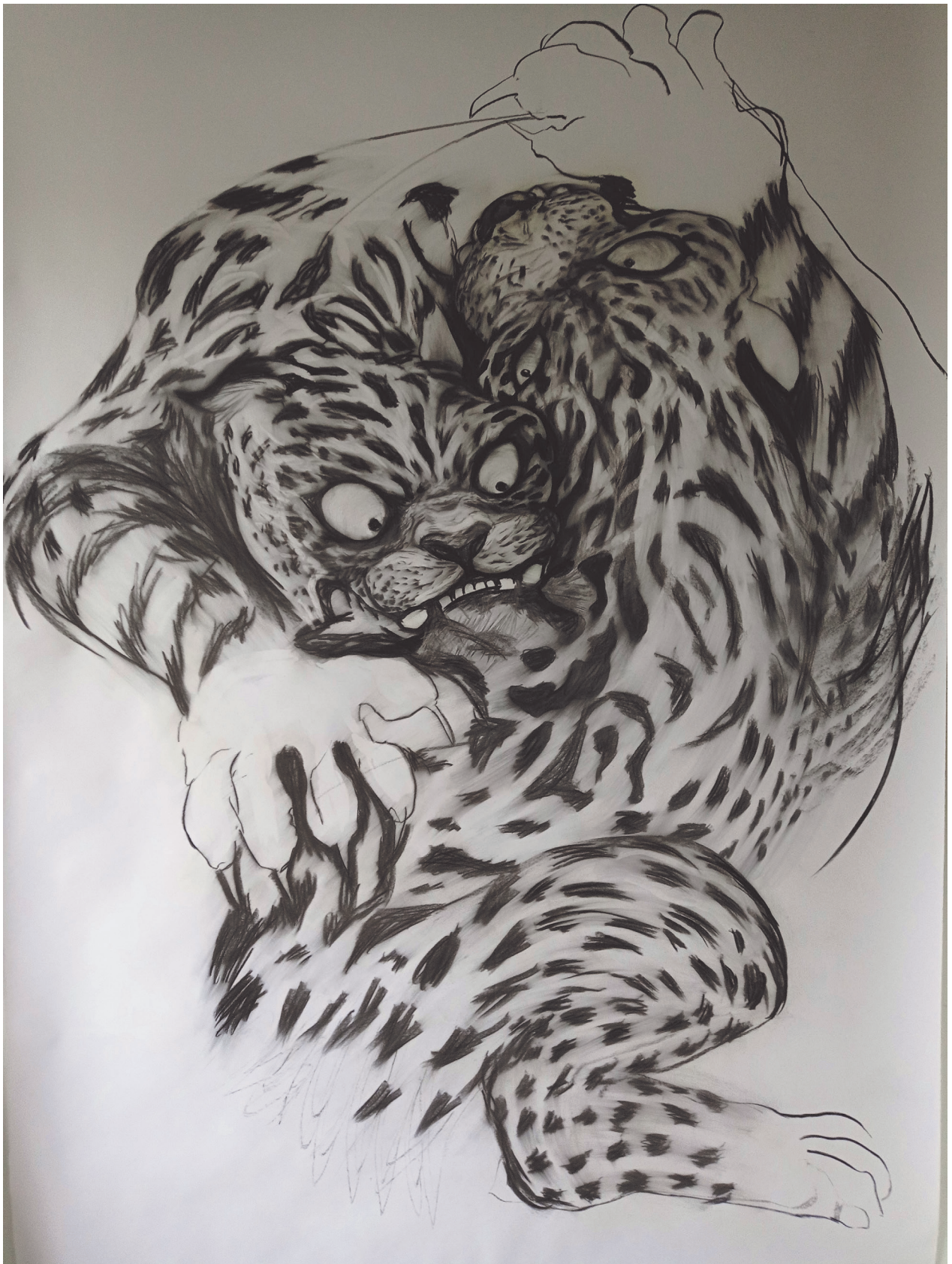
Le duel fusain sur papier 214x150cm 2021