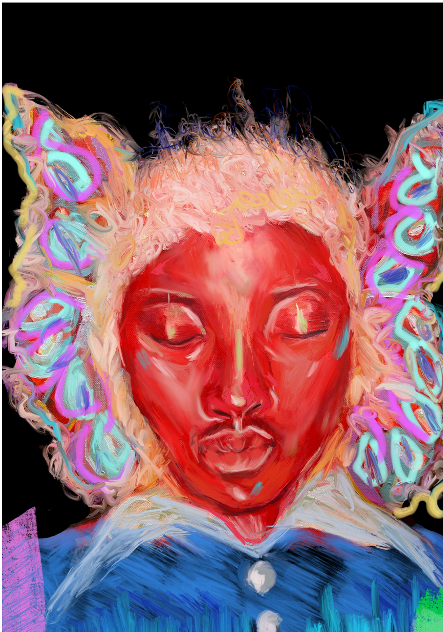
Nommos - dessin digital, 2025