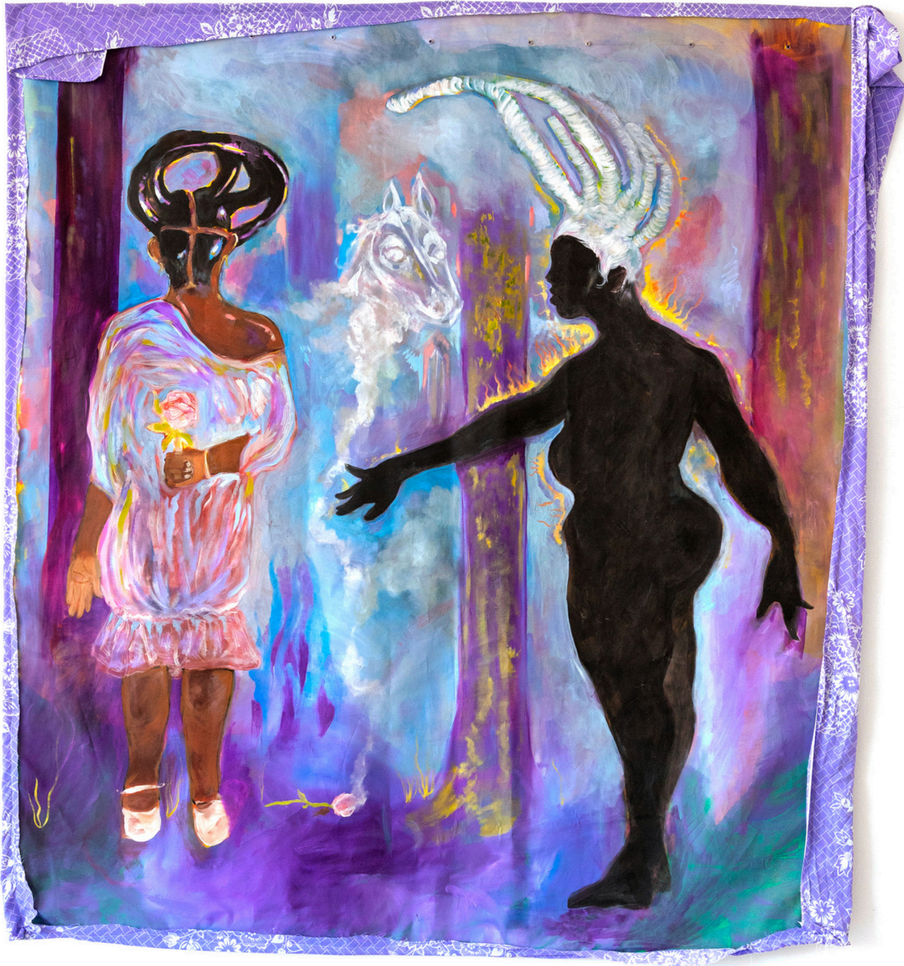
Coumba et la Yumboe – Huile sur toile, 165 x 182 cm 2024