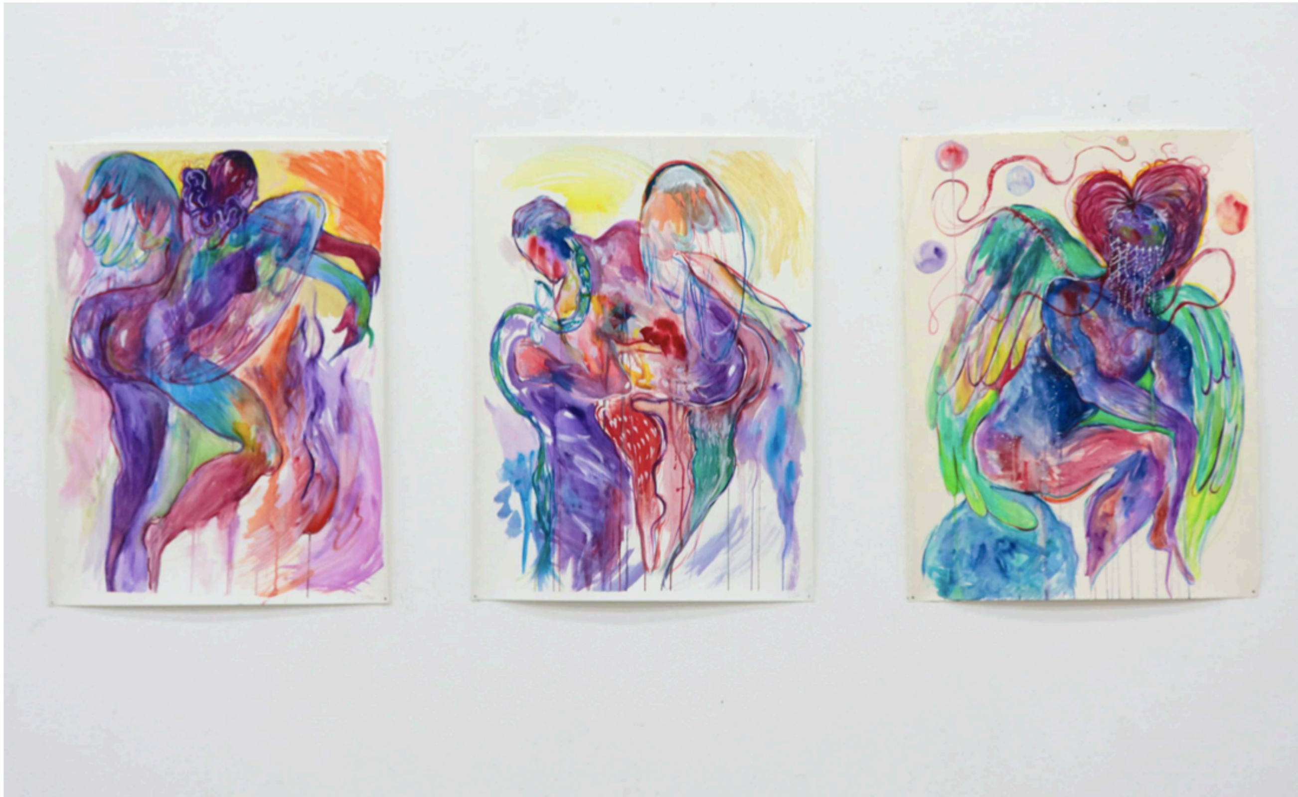
Créatures mystiques – Aquarelle sur Papier, A2 format, 2023/2024 (series)