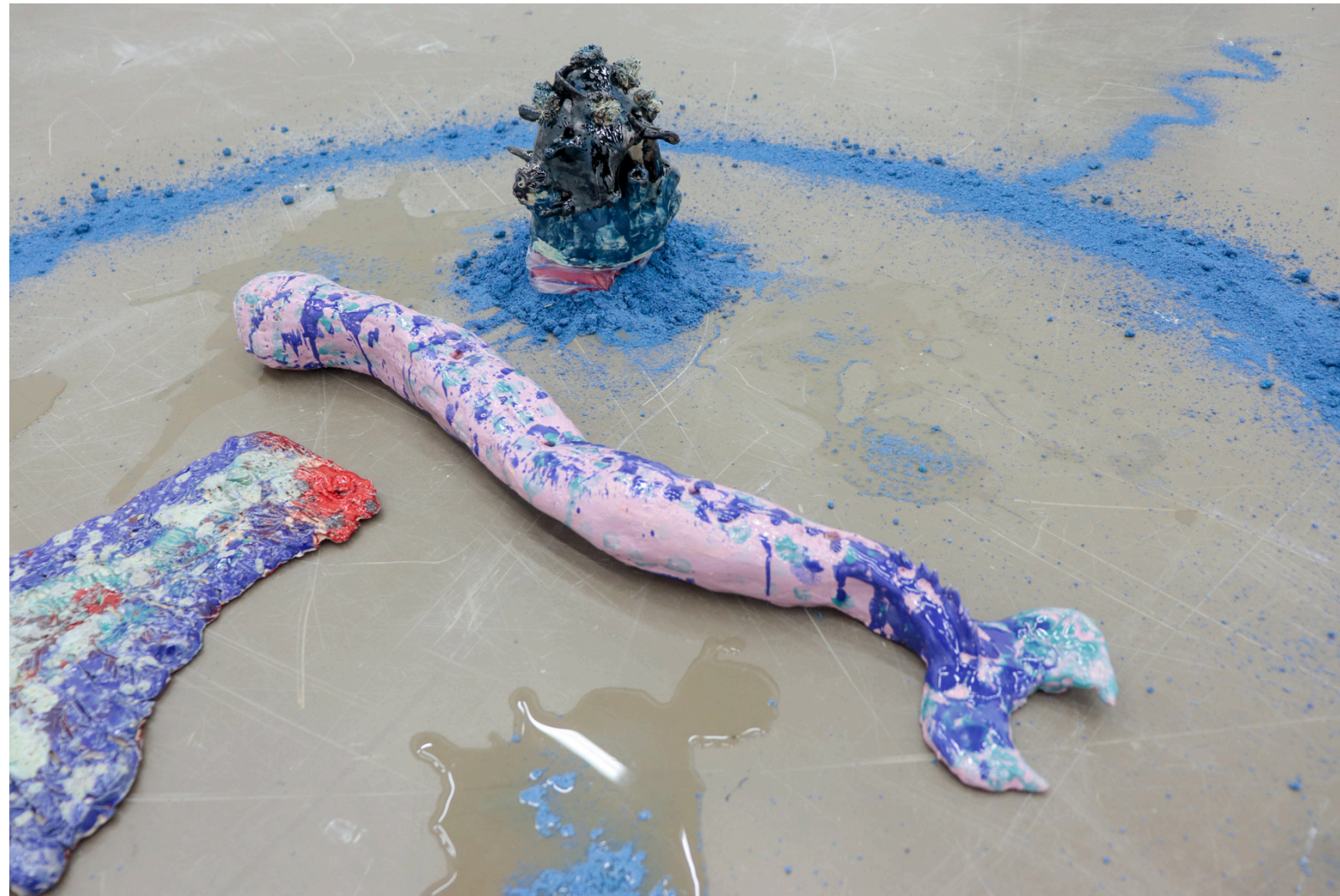
Drexciya and Other Tales Céramique, sable, colorants, son, eau, 2024