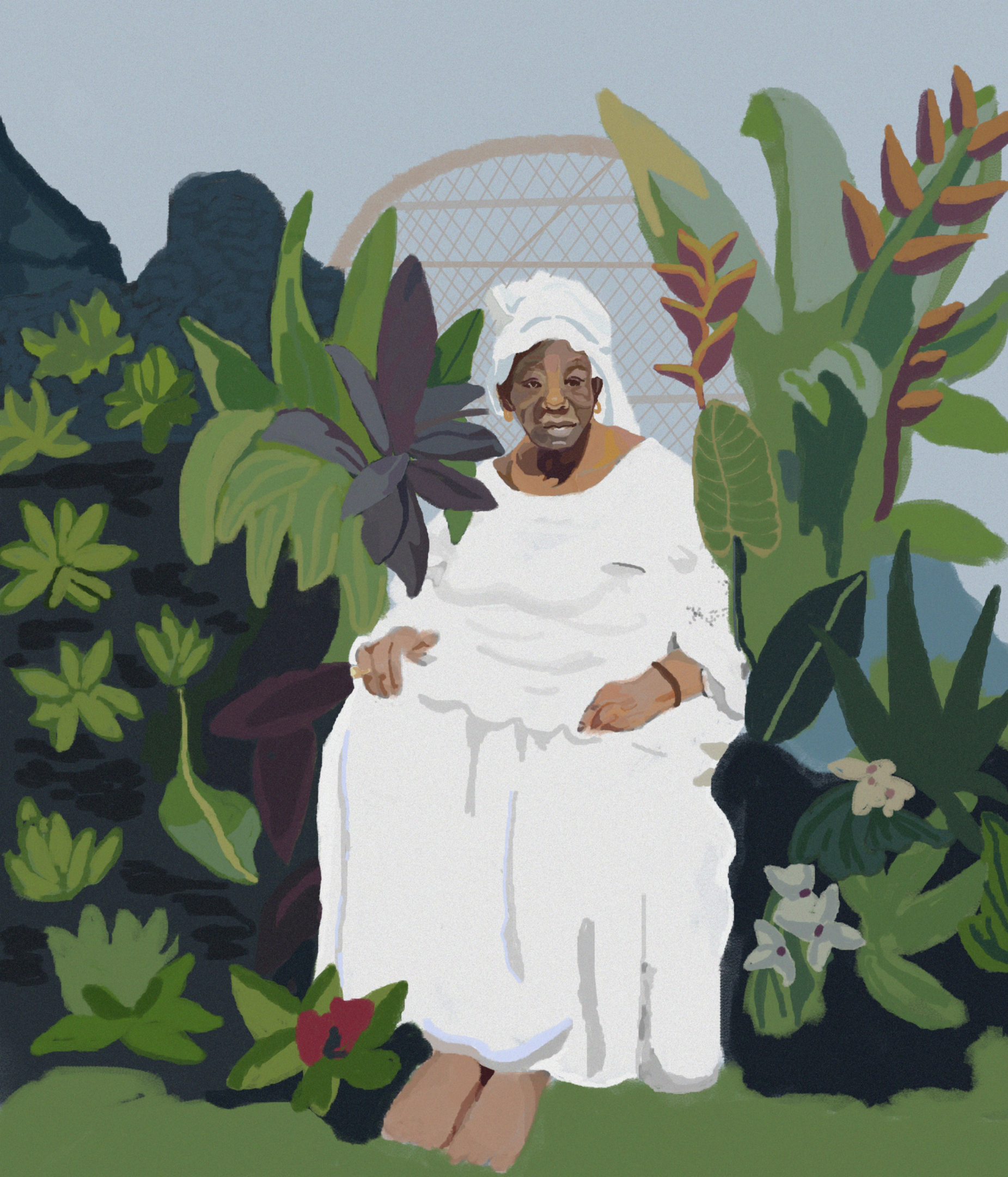
Mame boye, Grandma - Dessin digital, 2021