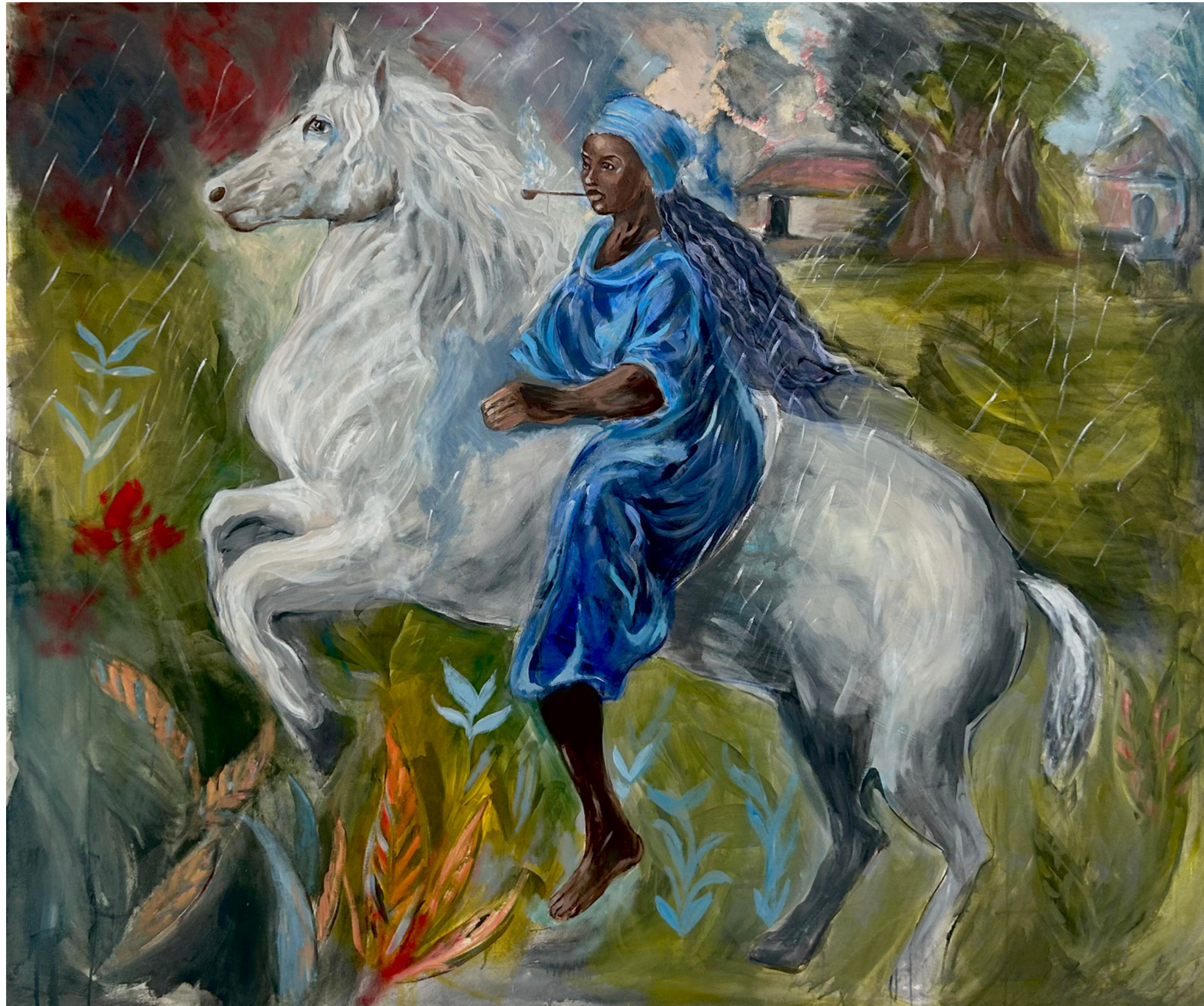
Aline sittoe Diatta - Techniques mixtes sur toile, 170 x 146 cm, 2025