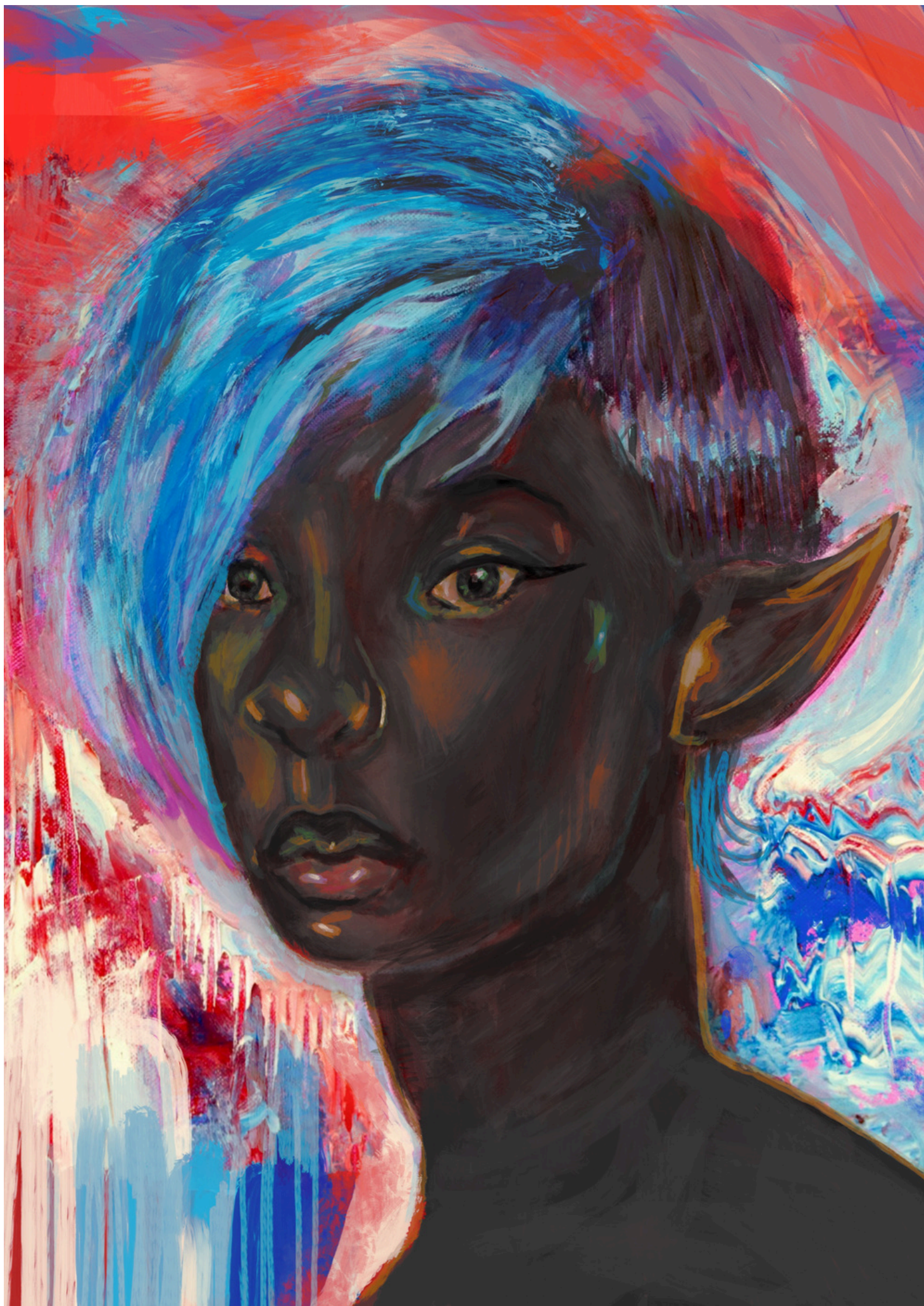
Pop culture nymph- Dessin digital, 2025