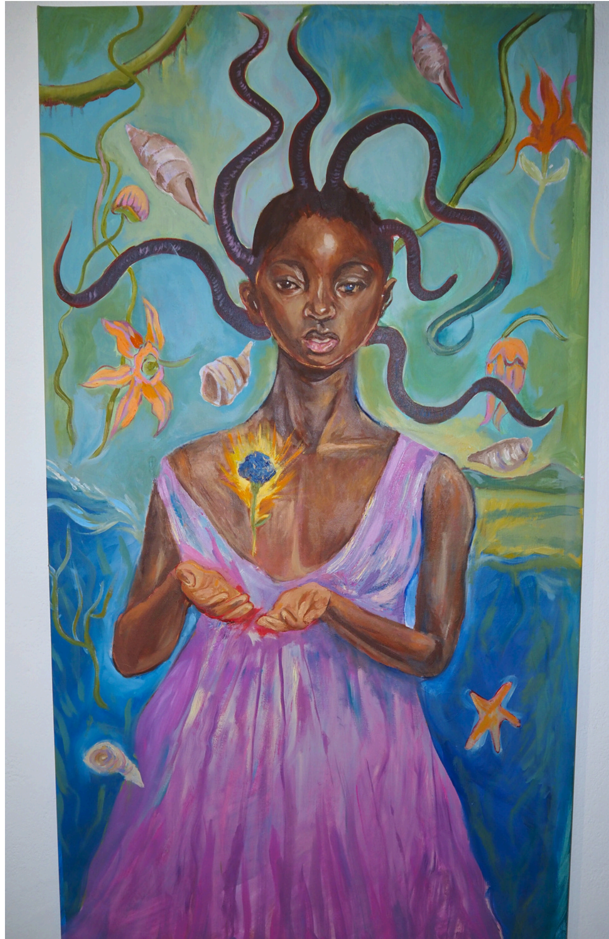
Xenogenesis- Techniques mixtes sur toile, 80 x 146 cm, 2025