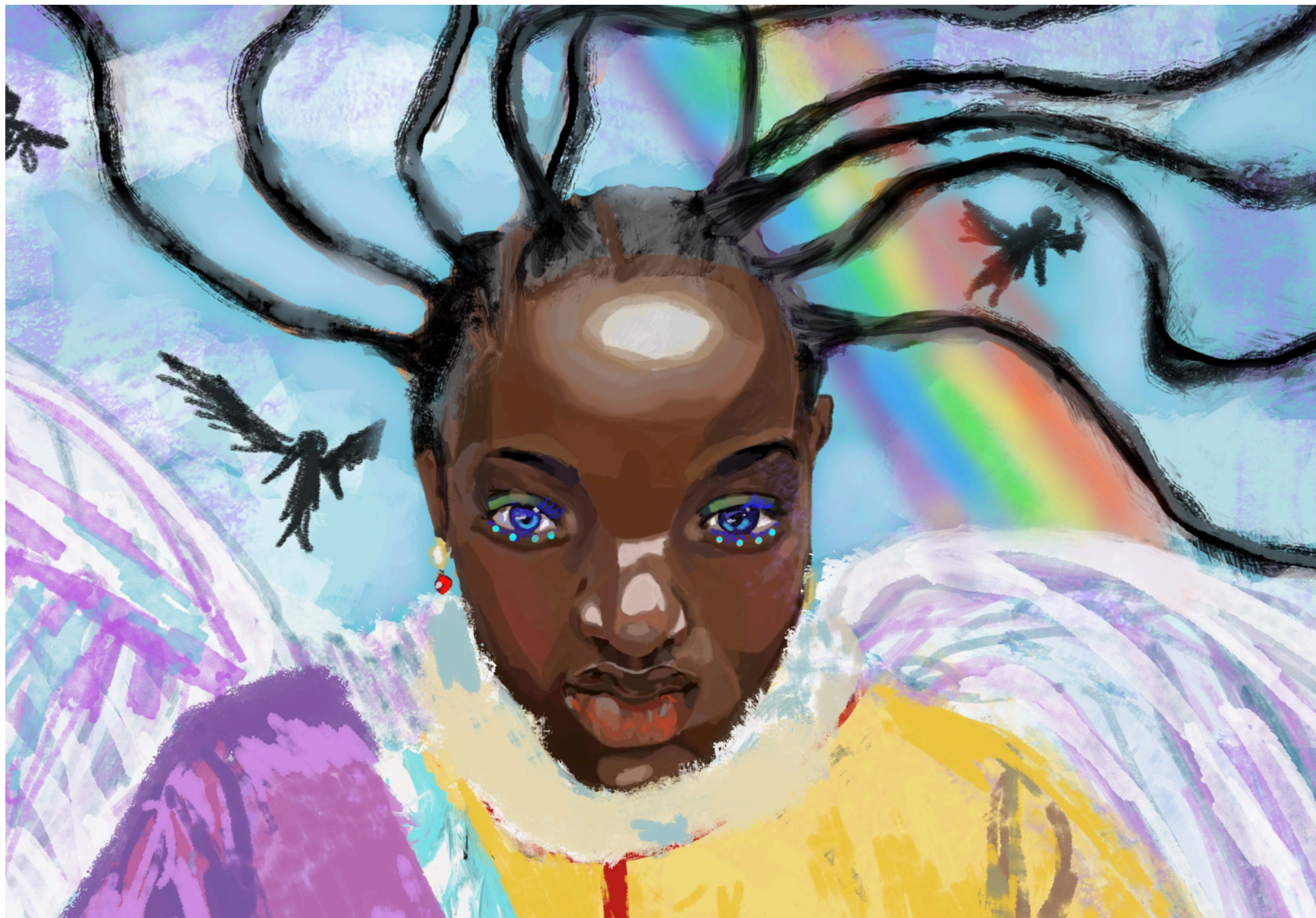
Xenogenesis 2 - dessin digital, 2025