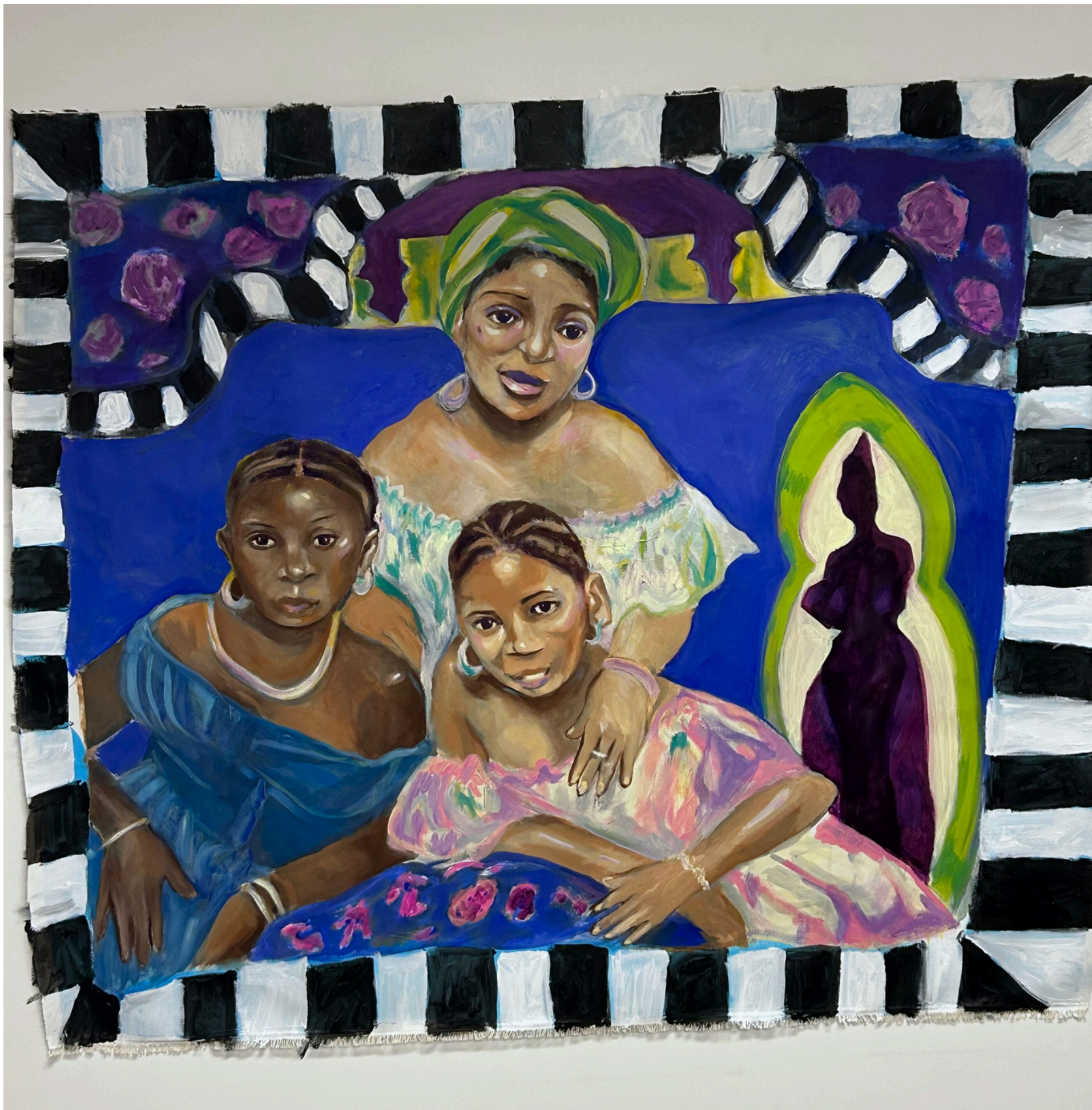
Héritage - Techniques mixtes sur toile, 125 x 115 cm