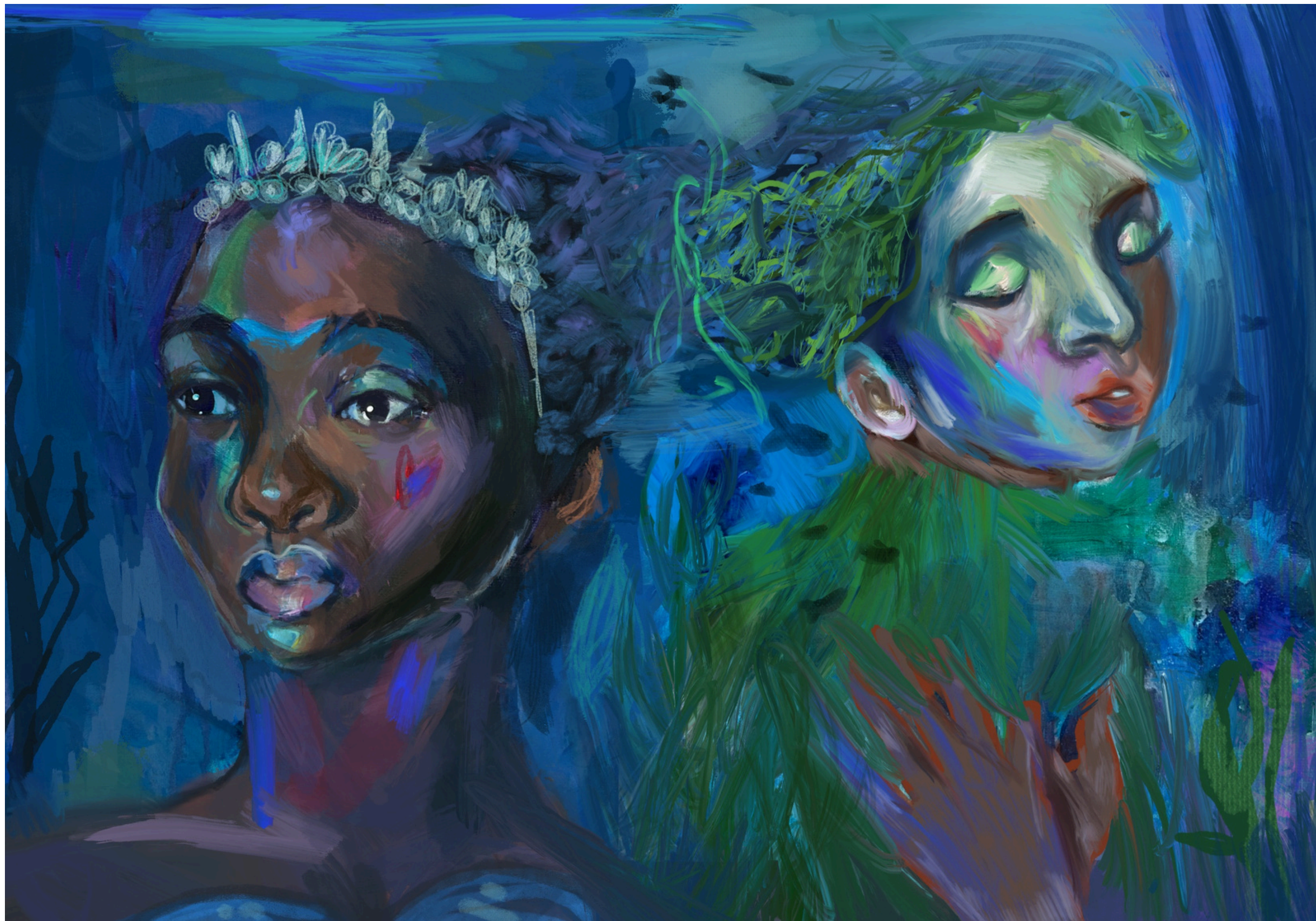
Drexcyiens en deuil - Dessin digital, 2025