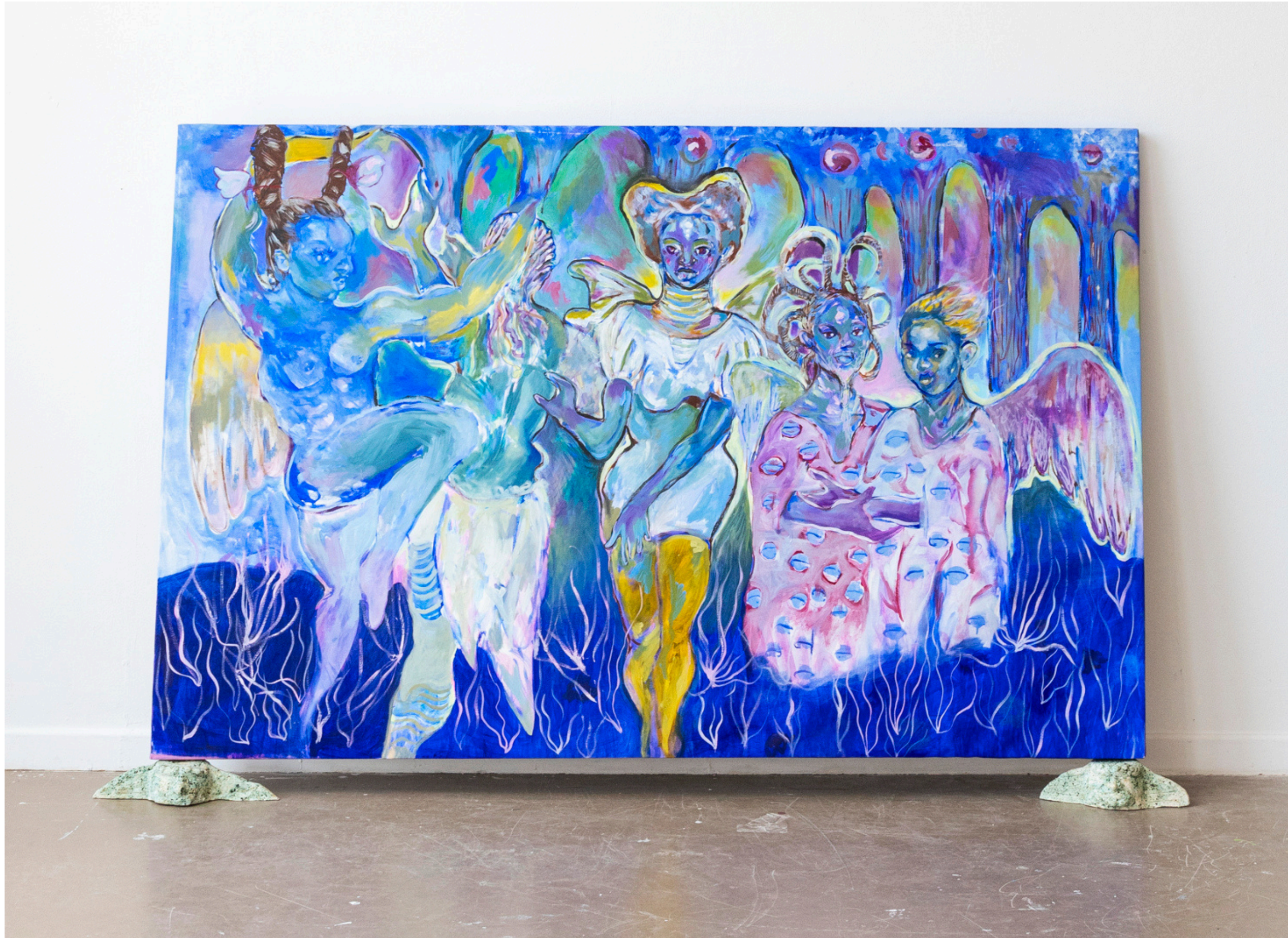
Cosmic Celebration – Techniques mixtes sur toile et céramique, 2023. 175 x 95 cm