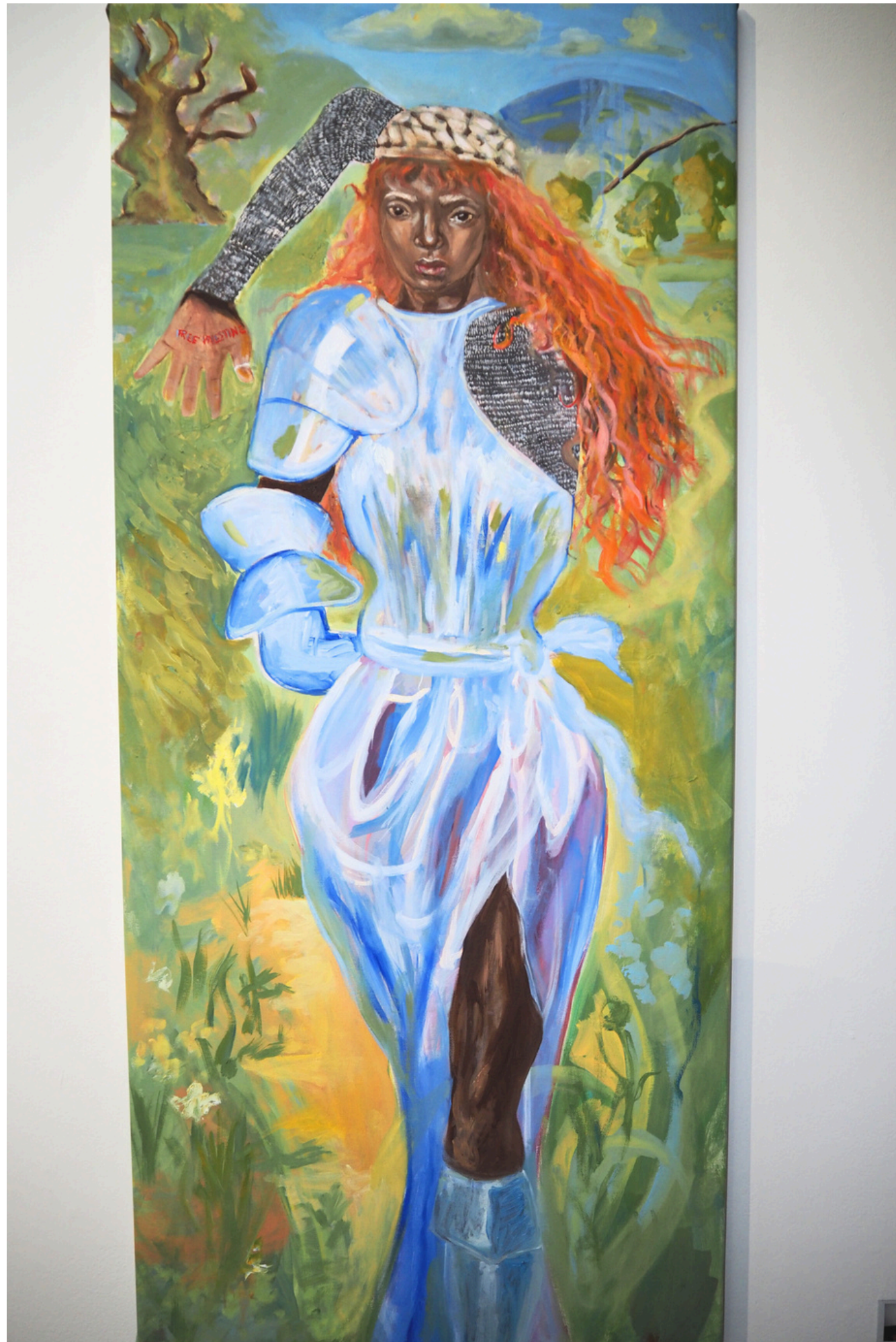
Freedom Fighter- Techniques mixtes sur toile, 65 x 150 cm, 2025